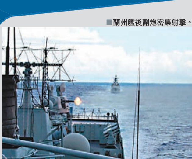
蘭州艦後副炮密集射擊。