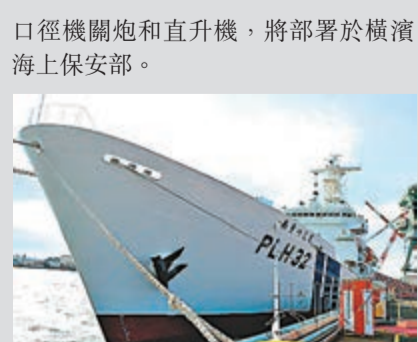
「秋津島」號在橫濱碼頭區的造船公司交付日本海上保安廳。