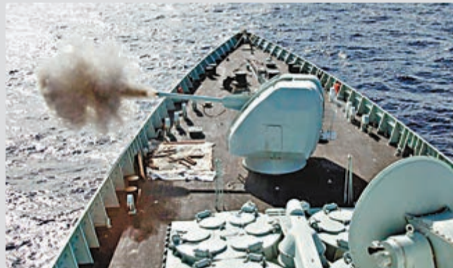
蘭州艦主炮連續射擊。