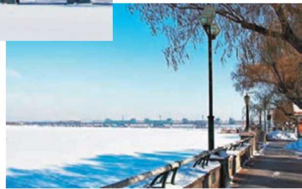
■松花江畔斯大林公園雪景