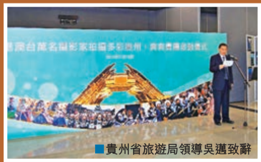
■貴州省旅遊局領導吳邁致辭