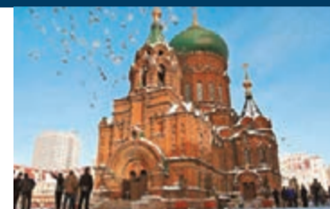
■雪後的聖·索菲亞教堂

如果說哈爾濱是一個美麗的新娘，中央大街則是新娘最美麗的臉龐。作為哈爾濱最為亮麗的一張名片，這條始建於1898年的大街承載着哈爾濱的歷史和文化，也蘊藏着哈爾濱今天的發展與未來。在這裡，你可以踩着百年的「麵包石」慢慢前行，感受老街歷史的車轍；你可以舉起相機對準每一個古老建築的窗櫺，尋覓它們所承載的滄桑與浮華；你可以信步走進華梅西餐館，想像這裡當年的紙醉金迷；你可以端上一杯熱咖啡透過窗花看着街上如鯽遊人，讓漫天的雪花伴思緒一起飄散。之於遊人，之於市民，中央大街永遠都是充滿魅力的夢想之地。