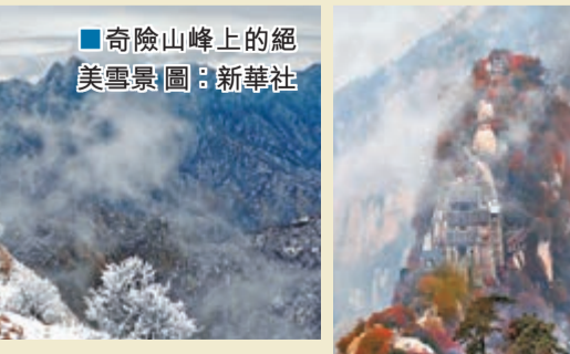
■奇險山峰上的絕美雪景圖：新華社

陝西省渭南市山明水秀、風光明媚，亦是中共中央總書記習近平的家鄉。早前，陝西省渭南市及華山風景名勝區管理委員會特別來港舉辦「魅力渭南·西嶽華山香港旅遊推介會」，展示了華山最新的生態環境照片，尤其是作為自然風景取勝的西嶽華山，冬季華山旅遊更是美景不斷，「雪海」、「雪松」、「霧凇」、「冰掛」、「冰瀑」、「冰雕」等景觀，為華山的美增添了不少的魅力，讓冬日的華山如水墨畫般濃墨厚、充滿韻味。冬遊華山，登高賞雪，挑戰自我，可算是冬季旅遊一個新亮點。