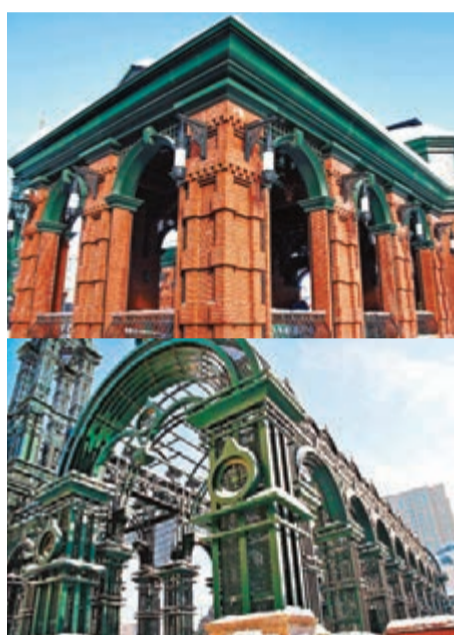
■哈爾濱雪後的別致建築。