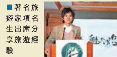
■著名旅遊家項名生出席分享旅遊經驗