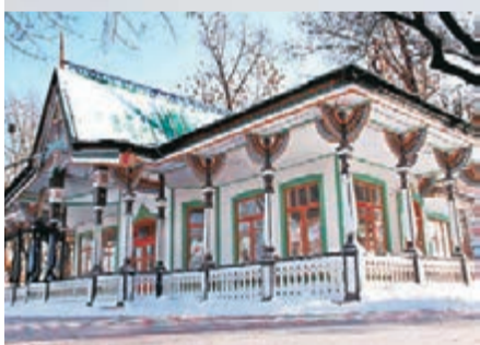
■松花江畔俄式建築