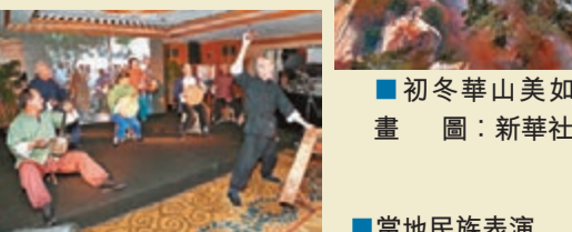
■初冬華山美如畫