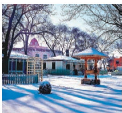
■哈爾濱俄羅斯風情小鎮。

今年11月中下旬以來，哈爾濱陸續迎來了幾場大暴雪。50年難得一見的厚厚積雪雖為城市交通造成了不便，卻也給市民和遊客帶來了無窮的雪趣，無論是松花江畔、中央大街等知名景點，還是休閒廣場、市民公園的一步一景，都蕩漾着人們賞雪、拍雪、玩雪的歡聲笑語。