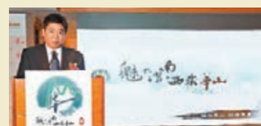
■陝西省渭南市政府副秘書長兼華山風景名勝區管理委員會主任霍文軍介紹華山最新的旅遊及生態發展。