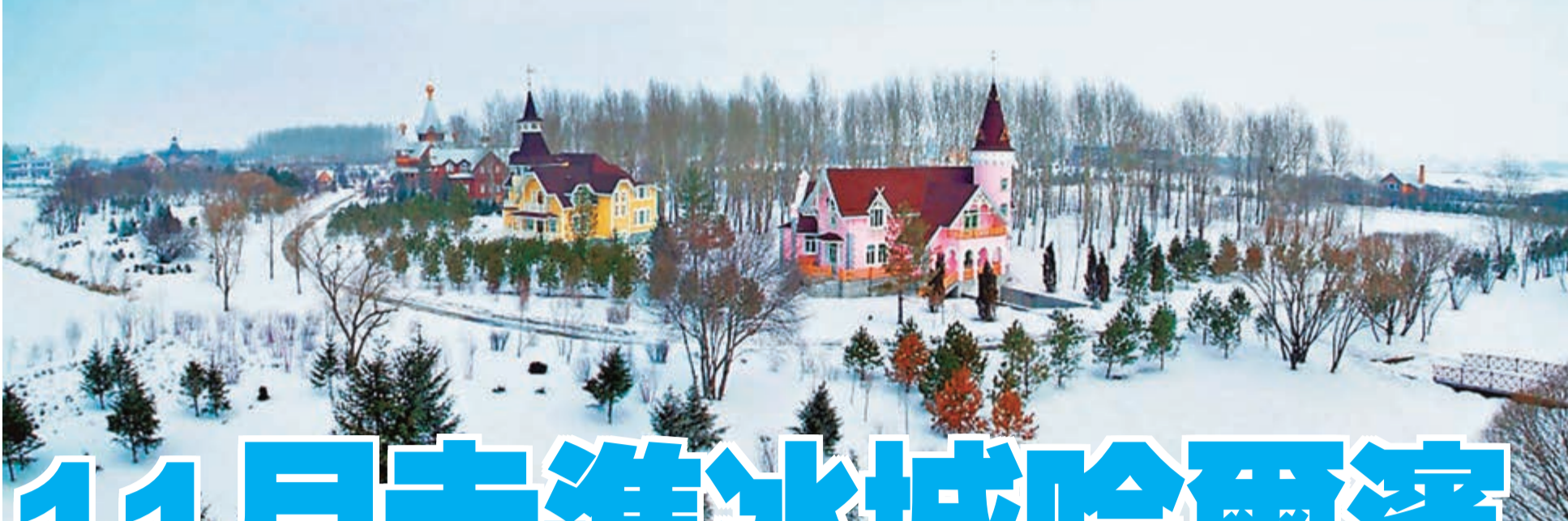
■哈爾濱伏爾加莊園雪景