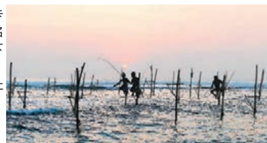
■落日餘暉下的美麗邊城