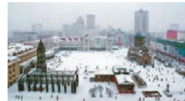
■雪中的聖·索菲亞教堂廣場

教堂之旅是遊覽哈爾濱不可或缺的經典旅程。哈爾濱特殊的歷史背景造就了她獨特的「教堂之城」。這座美麗的城市曾有70餘座教堂，東正教、天主教、基督教、猶太教、伊斯蘭教……各種教派共存，各派教堂叢生。現今存世的教堂有54座，對外開放且具觀賞價值的有聖·索菲亞教堂，這裡是每一個觀光客的必經之地，其景致讓遊客和攝影愛好者興奮不已；雪後清澈如洗的湛藍天空，更顯莊嚴肅穆的教堂，積雪覆蓋的圓形穹頂，時而盤旋而過的快活鴿群，在此留下愛情見證的美麗新娘……人們追隨着景致，在廣場前，階梯上，紅磚旁，一個個快門按了下去，一張張回憶珍藏了起來。