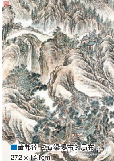
■董邦達《石梁瀑布》局部 272×141cm

剛剛收槌的北京嘉德「開卷有益」專場中，董邦達收錄於《石梁寶笈》的《葛洪山八景》4400萬港元落槌，市場人士認為中國古代書畫難鑑定，「就普通藏家比較難，而文徵明、董邦達的價格說明好的、有依據的拍品市場反響仍會熱烈」，就未來的行情如何，拍賣公司的業績並非最主要依據，而只作為參考數據未能標識出市場冷暖。