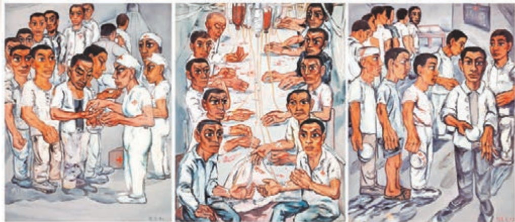
■曾梵志《協和醫院系列之三》(三聯畫)，1992年，150×345公分

代藝術處於青黃不接的狀態，除了前一波藝術家的價格可能還處於調整中。但令很多人更焦慮的是，大家更想知道中國當代藝術的未來在哪裡。