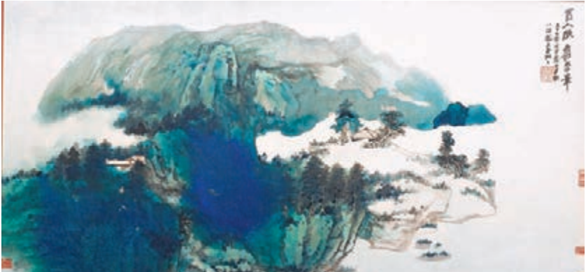
■張大千1968年畫作《關浦晴嵐》，設色紙本鏡框，98×193公分

《關浦晴嵐》是張大千在巴西八德國所就，徵集這幅作品專家團差不多用了兩年時間。根據佳士得中國書畫部資深專家游世勳的講述，當時蔣經國在台灣開設的飯店請旅菲僑領蔡紹華經營，蔡氏在開業之前向大千求作此畫，後由蔡家私藏。玄妙處不在此，拍前的採訪中我們發現畫作的紙張有一道豎紋，作為張大千徒孫的游世勳向記者透露，張大千所用的紙是專門在日本定做的「羅紋宣」，這種紙很緊，張氏所用很重的礦物質顏料就會被托在上面而不被吸入紙內，「所以張大千之後也有些人在畫潑彩，比如謝稚柳，但都產生不出這種漂亮的分寶石光澤，很大部分原因就在此。」走近細看畫作潑彩的部分會有小顆粒呈現，游氏說成因在於畫家作畫待顏料漸乾時，將畫豎立起來，而顏料中的礦