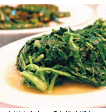
南嶽素食之一「六根清淨」。

香港文匯報訊(記者 董曉楠 湖南報導)經中國烹飪協會按照《認定工作管理辦法》的標準,衡陽市南嶽區獲授首家「中國素食之鄉」稱號。此次參加考察評估的專家認為南嶽素食不僅擁有完整成熟的素食風味個性和技術體系,而且還擁有久遠的發展歷程、鮮明的風味個性和廣闊的消費市場。