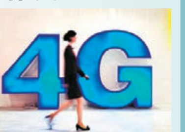
今年底貴州省將建4000個4G基站。

香港文匯報訊(實習記者 查雨施 綜合報導)今年年底,貴州移動將在貴州全省建設4000個4G基站,貴陽市雲岩、南明兩城區將實現4G網絡全覆蓋,覆蓋區域還包括觀山湖、白雲區、烏當區和花溪區的大部分區域。