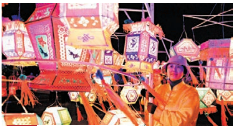
江西民間燈彩大賽 2013婺源·中國鄉村文化旅遊節暨「山花獎」全國民間燈彩大賽在江西婺源舉行。圖為婺源縣忠口鎮村民在展示手提花燈。來自山東、河南、湖北、河北、陝西等地的12個省代表隊和婺源燈彩展演隊一起進行燈彩展演。期間,還有中華燈彩遊園活動和中華燈彩攝影大賽等。

香港文匯報訊(記者 葉臻瑜 廈門報導)福建省廈門市海滄區日前頒布新規,全區黨政機關及所屬事業人員因公外出距離不滿3公里者,除特別情況外,一律騎乘自行車或步行前往,不再派公車。記者了解到,今次啟用的公務自行車系統是海滄區公共自行車系統的子系統,規劃建設10個站點,覆蓋到海滄區行政中心還有部分行政事業單位,以及區屬的國有企業等。目前已經完成了公務站點建設總共是5個,到位的自行車有120輛。