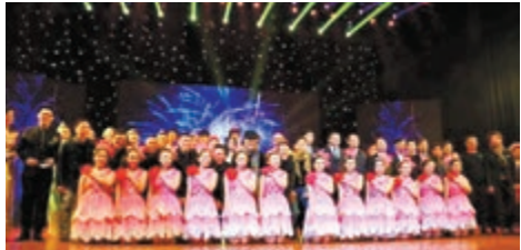
第六屆「雪狼杯」動畫大賽頒獎盛典在吉林動畫學院文化藝術中心圓滿落下帷幕。

香港文匯報訊(記者 蘇志堅 長春報導)第六屆「雪狼杯」(吉林動畫學院杯)動畫作品大賽頒獎盛典,11月25日晚上在吉林動畫學院舉行。來自國內外的14部作品分獲大獎。