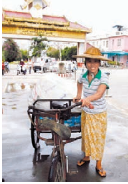
《總體方案》出台將促進雲南邊境貿易發展。