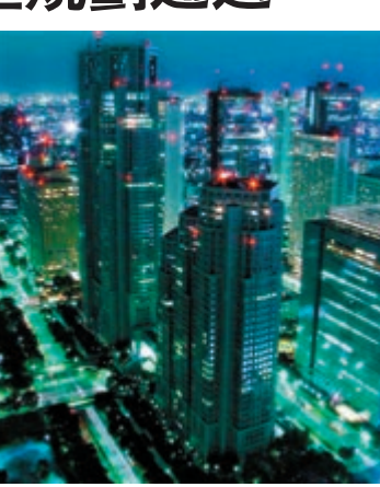
安徽通過《主體功能區規劃》發展全省,圖為合肥城區。

香港文匯報訊(記者 張玲傑 合肥報導)近日安徽省省長王學軍主持召開了省政府第15次常務會議,審議並原則通過了《安徽省主體功能區規劃》。規劃將全省國土空間劃分為重點開發區域、限制開發區域和禁止開發區域,力爭到2020年,國土空間開發新格局基本確立,主體功能更加突出,生產空間集約高效,生活空間舒適宜居,生態空間自然秀美。