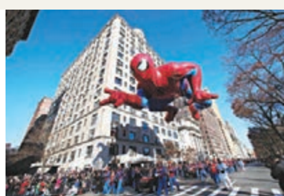
紐約中央公園的巨型「蜘蛛俠」已準備好在感恩節大巡遊出動。