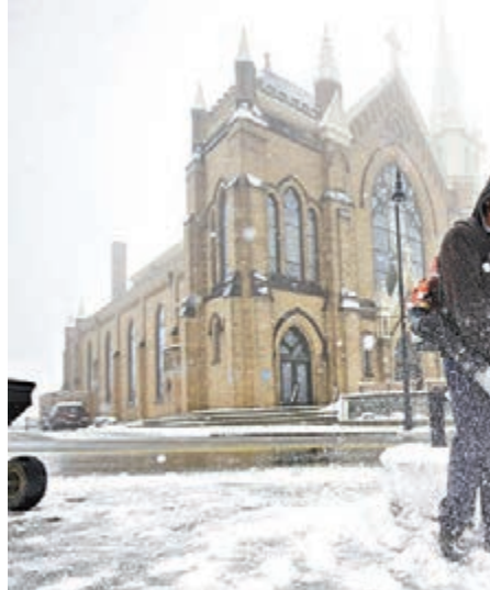
受暴風雪天氣影響，賓夕法尼亞州開始降雪。