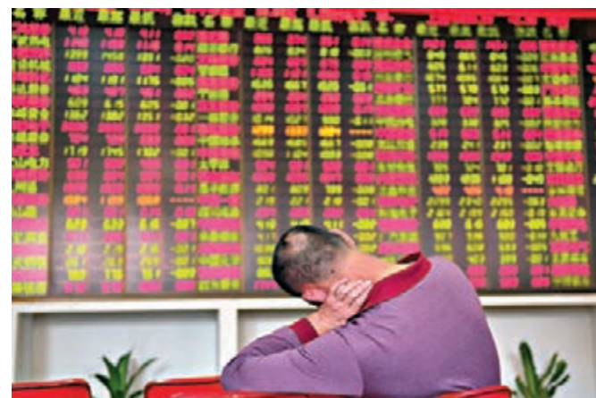
圖為海口某證券交易大廳內的股民關注大盤走勢。

香港文匯報訊（記者 袁毅 上海報導）中石化旗下的青島輸油管道上周五發生爆炸，中石化昨低開近4%，拖累滬深兩市大幅低開，但保險、券商等權重藍籌板塊強勢護盤，上午股指低開高走。但午後權重回調，股指一路下行，滬指跌破2,200點及5日均線，最終收報2,186，跌10點或幅0.47%，成交967億（人民幣，下同）；深成指報8,379點，跌33點或0.40%，成交1033億。