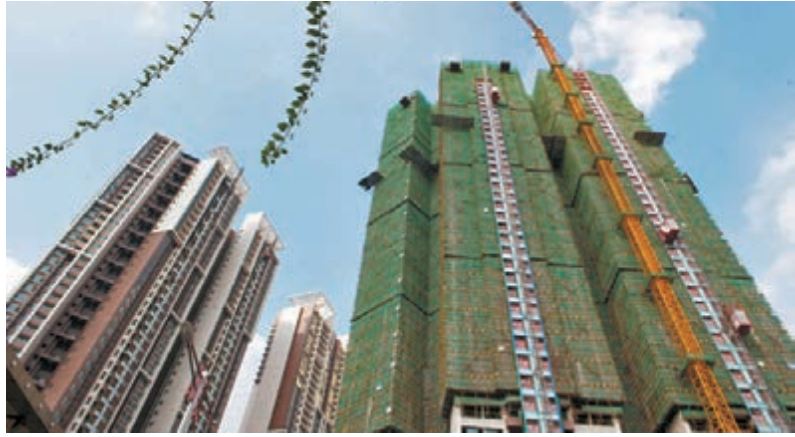
「穗六條」推出一周，全市新盤中料有10%已簽合同的交易面臨「退房」。圖為廣州市金沙洲在建的樓盤。

中房信研究總監薛建雄表示，受新政影響，上海樓市成交量將逐步下滑，房價步入滯漲。「本周末新增入市的多個樓盤，價格都比較適中，基本停滯了。」其預計接下來滬上樓市房價都將處於滯漲狀態，一直到明年3月份，樓盤開盤價格基本不會上漲，甚至可能下跌。