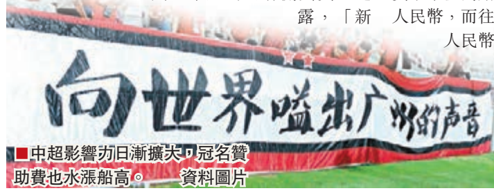
中超影響力日漸擴大,冠名贊助費也水漲船高。 資料圖片