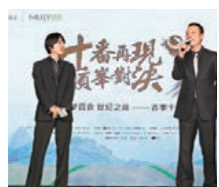
古力(右)和李世石日前發表迎戰宣言。

古力、李世石的十番棋24日在北京舉行新聞發佈會。比賽每盤對局每方基本用時4小時,先勝6盤者為最終勝者,收穫全部的500萬元獎金。如最終5:5戰平,不再進行加賽,雙方平分全部獎金。明年1月起,古力和李世石將在北京、上海、成都、香格里拉、拉薩、重慶等10座城市進行對決。