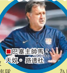
巴塞主帥馬天奴。路透社

明晨，西甲領頭羊巴塞羅那將在歐聯H組客場對陣荷甲阿積士。巴塞已經提前出線，只要踢和就將穩獲小組首名。對於主帥馬天奴而言，他還很有可能率隊追平前主帥哥迪奧拿21場不敗的巴塞歷史紀錄。(有線63台明日03:45a.m.直播)另外，原本指巴塞之魂美斯休息6至8個星期就可復出，但據報稱，其實美斯的左腳二頭肌肌肉纖維撕裂長度達6厘米，傷勢屬於嚴重級別，應該要休3個月，疑巴塞軍醫報細數；同時間，美斯接受訪問時，承認很多球隊對他感興趣，但他