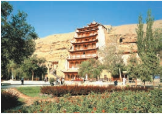
莫高窟今年冬春增開旺季不曾開放的精美洞窟。