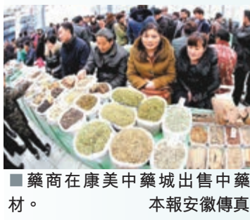
藥商在康美中藥城出售中藥材。

香港文匯報訊（記者 張玲傑、實習記者 朱洪剛 合肥報導）全球最大的中藥交易市場，亳州康美中藥城近日在安徽省亳州市正式開業。這個總投資15億元，佔地1000畝，建築面積120萬平方米的中藥城，內有交易大廳10萬平方米，是目前全球最大的中藥材交易市場。 亳州市是聞名遐邇的「中華藥都」，是全國最大的中藥材集散地。據了解，亳州市原中藥材交易中心成立於1995年，受條件限制，交易中心一直存在着硬件設施老化、管理落後等問題，隨着市場的不斷發展，交易中心已經不能滿足現在的發展需求。如今康美中藥城不僅在面積上是原中藥材交易大廳的3倍，而且配套了金融、餐飲、通信等服務設施，功能更加完善。 據了解，康美中藥城預計運營兩年後，年銷售額可達50億元，項目全部建成後，預計年銷售額將超過100億元。