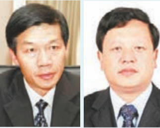
六盤水市委書記李再勇。現任遵義市委書記王曉光。

香港文匯報訊（記者 虎靜 綜合報導）貴州兩個地級市的黨委書記職位出現變動。原貴州遵義市委書記廖少華因涉嫌嚴重違紀違法被免職後，遵義市委書記一職出現空缺。11月22及23日，貴州省委組織部宣佈，原六盤水市市委書記王曉光調任遵義市委書記，原貴陽市市長李再勇調任六盤水市市委書記。 今年52歲的王曉光於2001年至2006年，先後任貴陽市副市長，市委常委、市委秘書長等職；2006年11月至2008年5月，任遵義市委常委、常務副市長；2008年5月至2011年9月，任遵義市市長；2011年9月至2013年11月，任六盤水市市委書記。 今年51歲的李再勇，是貴州化