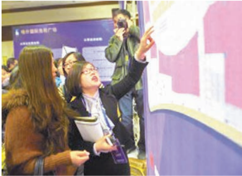
11月24日，喀什發展集團的工作人員向商戶介紹廣場的運營特點。

香港文匯報訊（記者 郭詠 新疆報導）11月24日，喀什經濟開發區經濟與產業發展論壇暨喀什國際免稅廣場品牌簽約發佈會傳來消息，喀什開始興建10萬平方米的喀什國際免稅廣場，正在申報免稅經營牌照，預計2015年開業，屆時或進駐品牌達兩三萬種。