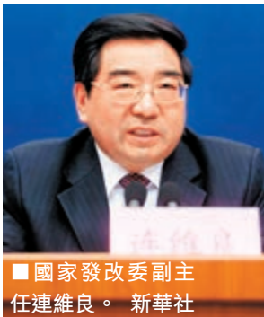
■國家發改委副主任連維良。

三中全會《決定》明確，要使市場在資源配置中發揮決定性作用和更好地發揮政府作用。連維良表示，按此要求，發改委作為國務院承擔宏觀調控和推進經濟體制改革的職能部門，將率先下放權力。「凡是市場能夠調節的經濟活動，政府一律不再審批；凡是企業投資項目，除了關係國家安全、生態安全，涉及全國重大生產力佈局、戰略性資源開發和重大公共利益等項目外，一律由企業依法依規自主決策，政府不再審批；在需保留的審批項目中，凡是直接面向基