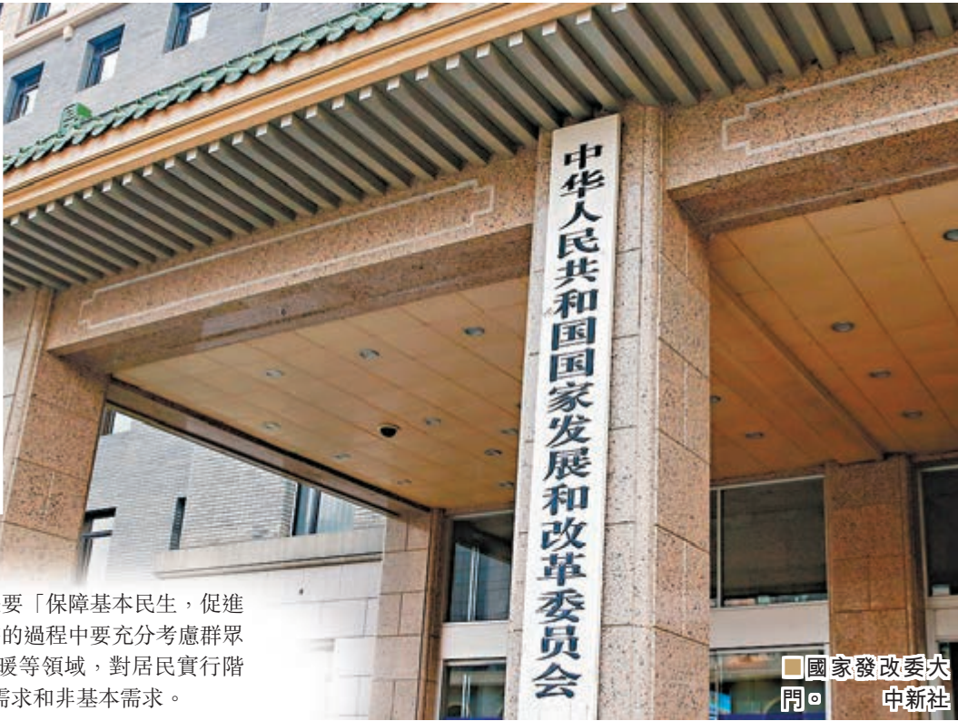
■國家發改委大門。