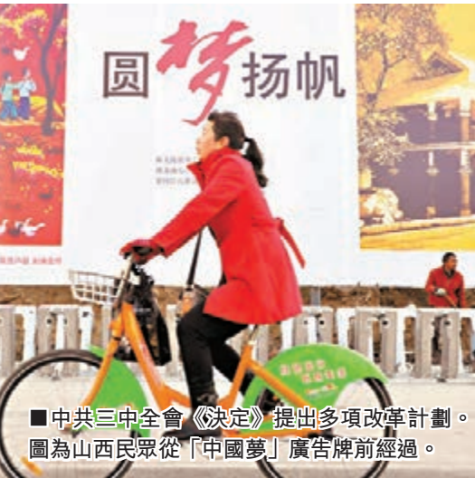
■中共三中全會《決定》提出多項改革計劃。圖為山西民眾從「中國夢」廣告牌前經過。

此外，在改革推進落實方面，連維良表示，國務院要求，今年已部署的各項重點改革任務，要盡快落實好，顯實效。