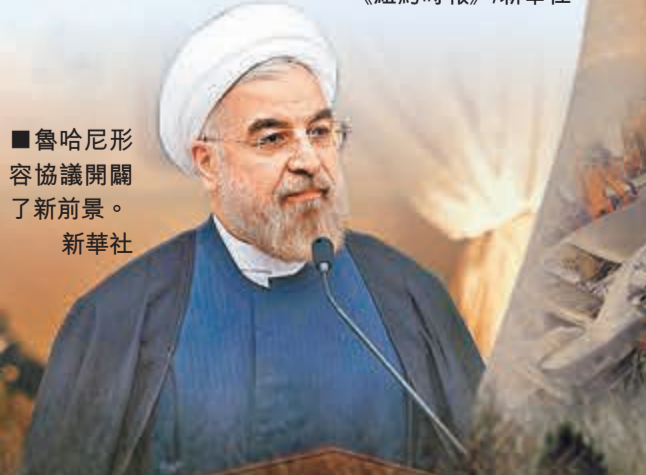
魯哈尼形容協議開闢了新前景。