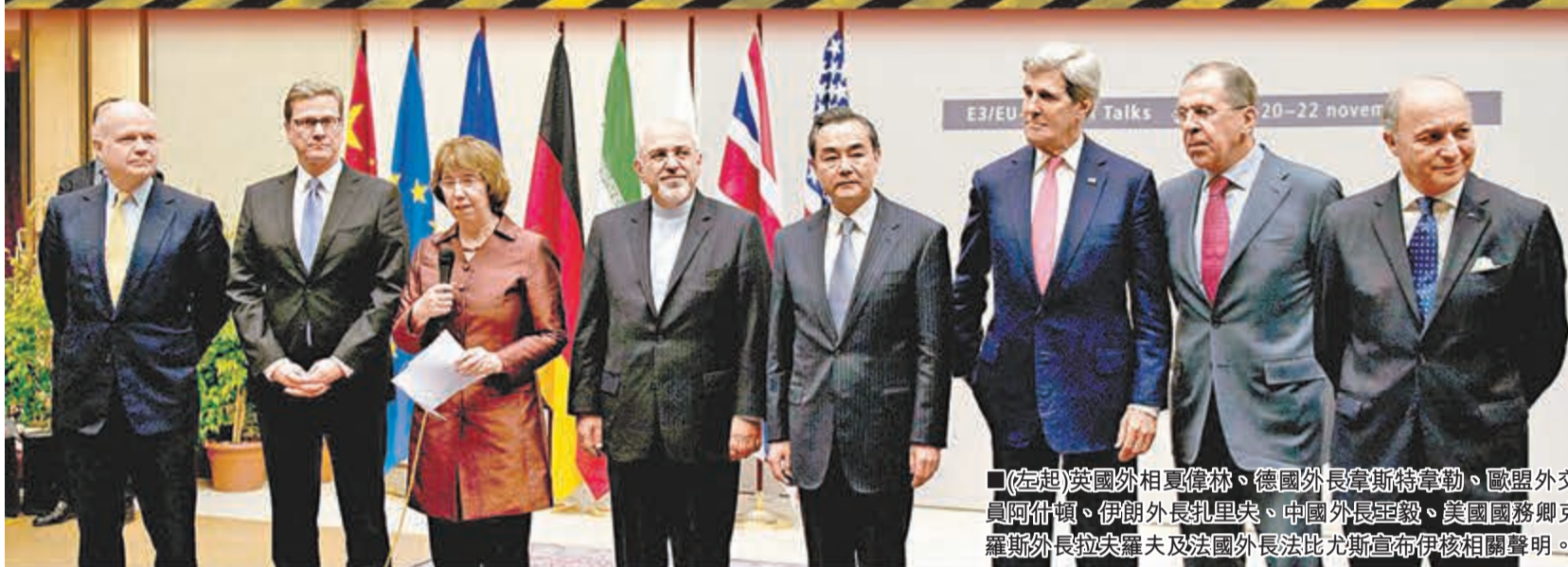
（左起）英國外相戴維林、德國外長韋斯特韋勒、歐盟外交事務專員阿什頓、伊朗外長魯里亞、中國外長王毅、美國國務卿克里、俄羅斯外長拉夫羅夫及法國外長法比尤斯宣布伊核相關聲明。

長達十年的伊朗核談判終於實現歷史性突破。伊朗與六國外長昨日在日內瓦達成首階段協議，德黑蘭同意在未來6個月內，停產5%濃度的濃縮鈾及停建懷疑用作製造核武的重水反應堆，換取國際社會暫時撤銷相當於70億美元（約542.7億港元）的部分制裁。美國總統奧巴馬形容協議邁出重要第一步；伊朗總統魯哈尼則指，協議意味六國承認該國的核權利。