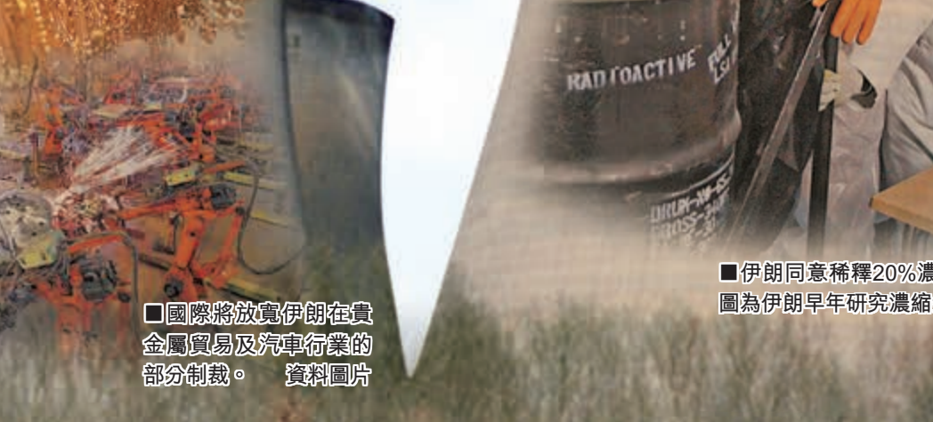
國際將放寬伊朗在貴金屬貿易及汽車行業的部分制裁。資料圖片

沙特王子阿爾瓦利德日前表示，奧巴馬是個需要勝利的人，認為他急於與伊朗達成協議，直指伊朗在玩弄奧巴馬。 ■路透社/彭博通訊社