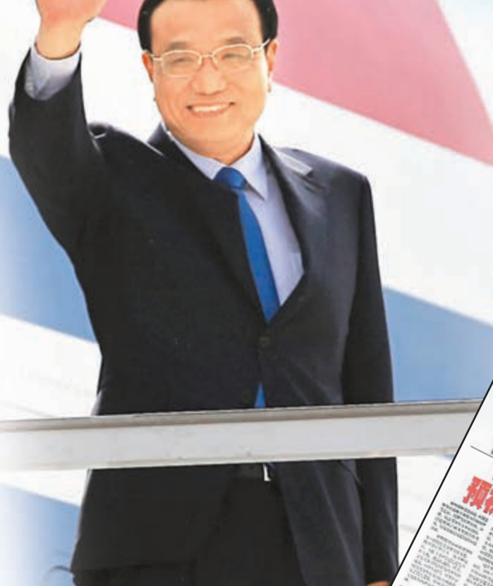
李克強今日展開對羅馬尼亞的訪問，這是19年來中國總理首次訪問該國。資料圖片