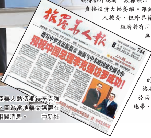
羅馬尼亞華人熱切期待李克強總理來訪。圖為當地華文媒體在頭版刊發相關消息。

無論是地緣政治家麥金德的「心臟地帶」說，還是德國地緣政治學理論，都將中東歐地區視為控制歐亞大陸，甚至整個世界的關鍵。在美蘇對峙的冷戰格局中，這一地區也被視為處於兩極潛在衝突最前沿的重要地帶，位置極為關鍵。 ■本報記者 孟慶舒 整理