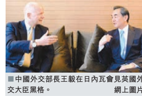
中國外交部長王毅在日內瓦會見英國外交大臣黑格。

香港文匯報訊 綜合消息：中國外交部長王毅表示，中英關係逐步重回正常發展軌道。 據中新社報道，王毅23日在日內瓦會見英國外交大臣黑格。王毅表示，今年6月以來，中英關係逐步重回正常發展軌道。希望雙方重建並鞏固互信，深化務實合作，在相互尊重、照顧彼此重大關切的基础上，發展兩國全面戰略夥伴關係。 黑格表示，英方高度重視中英關係，願與中方在相互尊重基礎上深化互信，推進在經貿、科技、教育等領域的務實合作，深化在國際和地區問題上的溝通協調，推動雙邊關係的發展。 據悉，英國首相卡梅倫將於12月初率領龐大經貿代表團訪華，英國財政大臣透露，卡梅倫的此次訪華內容豐富，包括鼓勵中國學生赴英留學，促進對華高科技出