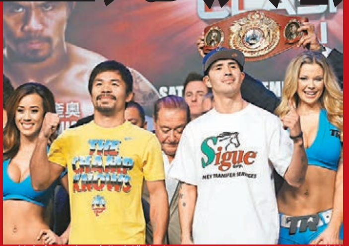
帕奎奧(左)與奧里斯先禮後兵。

在昨日的稱重儀式上,鄒市明較對手墨西哥人胡安·托斯卡諾顯得游刃有餘。當主持人讀出鄒市明的名字,現場千餘名拳迷報以歡呼,鄒市明享受的待遇僅次於打主賽的拳王曼尼·帕奎奧。 「鄒市明在賽前表現很好,不會在體重方面吃虧」,鄒市明的新科師弟、拳手楊連慧透過電話告訴中新社記者。 儘管此前兩場職業拳賽,鄒市明均以點數獲勝,但因打法仍帶有明顯的業餘痕跡而為人詬病。就連胡安也在受訪時批評「鄒習慣不斷進退和移動,並不擅長職業拳擊」。對此,鄒市明回應稱「剛剛找到打職業拳擊的感覺」。