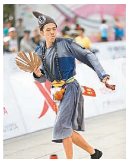
「濟公」也來參賽廣馬。

香港文匯報訊(記者敖敏輝廣州報導)11月23日,2013廣汽豐田廣州馬拉松鳴槍開跑,來自內地、港澳及海外2萬餘馬拉松專業選手和業餘愛好者參加了本次比賽。在專業組方面,男女兩組的全程馬拉松冠軍被埃塞俄比亞選手包攬,成為本次賽事的最大贏家。