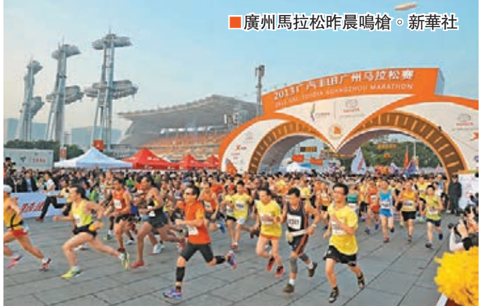
廣州馬拉松昨晨鳴槍。

療保障部門共救治5892人,其中10人送醫院接受救治。截至發稿時,選手血壓、心律正常,意識清醒,其中2人已出院,8人繼續留院觀察。