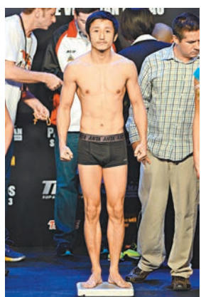
鄒市明過磅充滿自信。