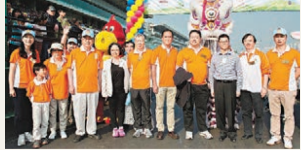
樂善堂舉行萬人行2013。

香港文匯報訊(記者 子京)由九龍樂善堂主辦之「樂善堂萬人行2013」日前假沙田馬場舉行，為該堂籌得超過120萬元善款。活動開步禮由社署副署長林嘉泰主禮。人氣歌手狄易達擔任「慈善步行大使」。