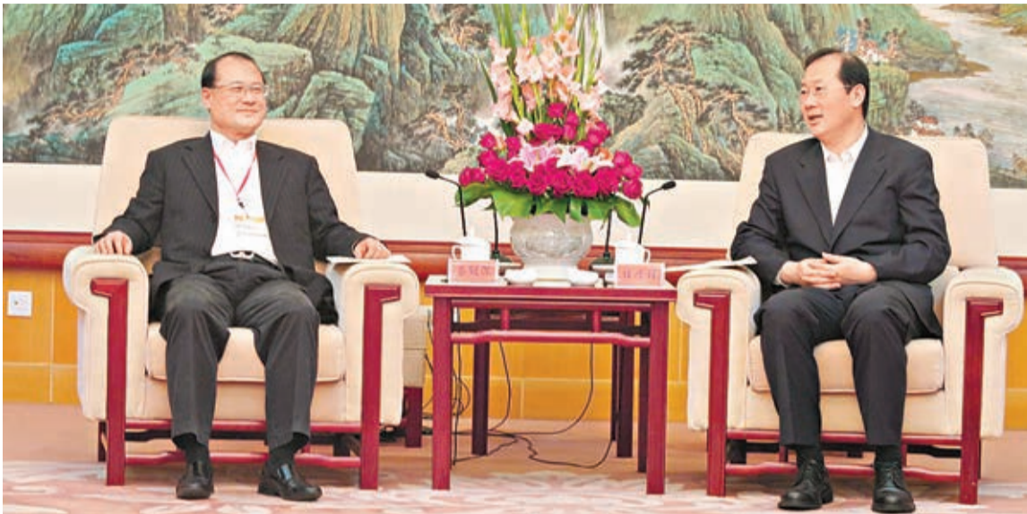
天津市副市長任學鋒(右)介紹京津合作帶來的發展機遇。