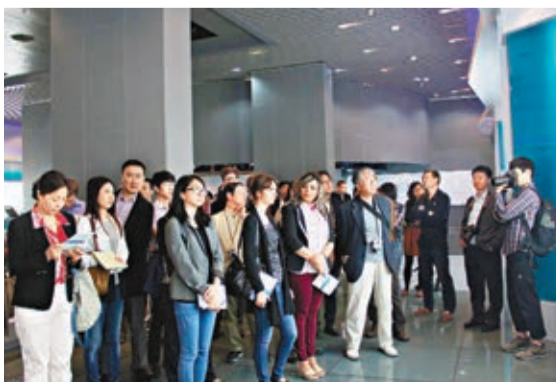
媒體團採訪前海，聽取開發介紹。

媒體團之後赴東莞，東莞市委副書記姚康及經信局、外經貿局等負責人向媒體團介紹推動傳統產業轉型升級情況。姚康透露，東莞已決定成立全面深化改革領導小組，下一步將研究《決定》與東莞實際情況結合的措施。東莞市委常委潘新潮說，東莞傳統行業轉型已有突破進展，去年4100多家來料加工廠已轉型企業法人。莞企拓內銷效果明顯，目前莞產商品1/3內銷，淘寶網30%的產品源自東莞。此外，聚集在厚街鎮的鞋業集群已從東莞製造轉向東莞設計、全球製造，商品附加值越來越高。