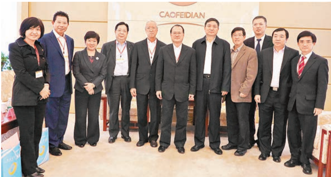
唐山市市長陳學軍(右5)認為香港與唐山在現代服務業上合作空間廣闊。

商機。秦皇島作為零距離的濱海城市，正推動產業、旅遊等方面的發展戰略，在項目建設、旅遊產業發展和城市基礎設施建設等與香港都有合作商機。