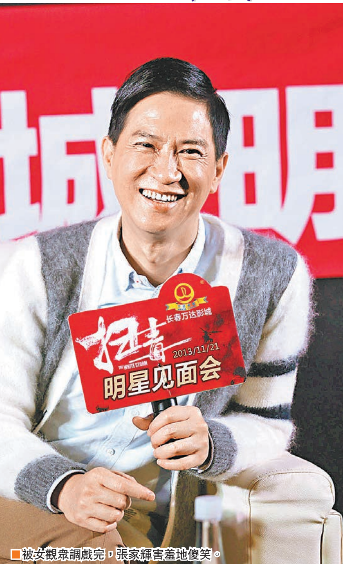
被女觀眾調戲完，張家輝害羞地傻笑。