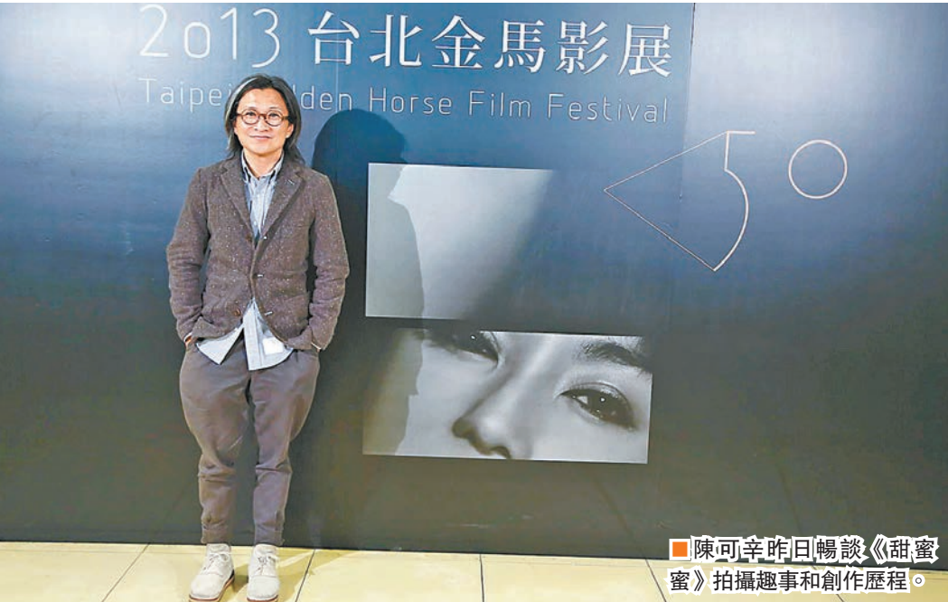
陳可辛昨日暢談《甜蜜蜜》拍攝趣事和創作歷程。

香港文匯報訊（記者 高麗丹）兩度榮獲金馬獎最佳導演的陳可辛，昨晚出席金馬50「大師講堂」《甜蜜蜜》映後座談，可容納500人的廳內座無虛席。昨晚也是威尼斯影展後，《甜蜜蜜》數位修復版首場亞洲放映。