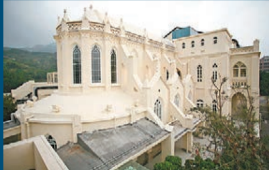
■建於1875年的伯大尼修院外觀。

香港文匯報訊(記者 文森)港府昨日宣布,古物事務監督根據《古物及古蹟條例》將兩幢位於港島的歷史建築,即中環和平紀念碑和薄扶林道139號伯大尼修院,列為法定古蹟。有關公告昨日刊憲。