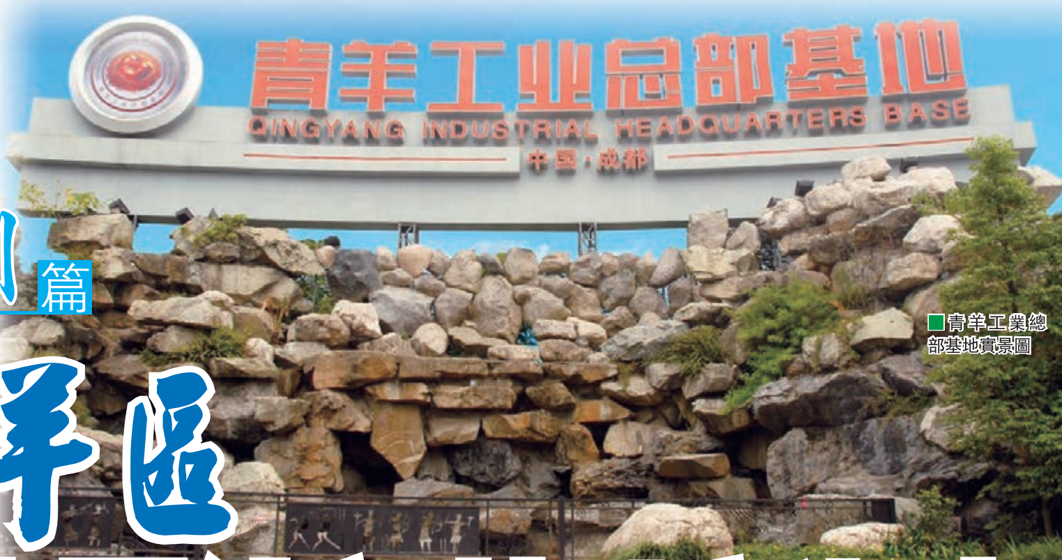
青羊工業總部基地實景圖