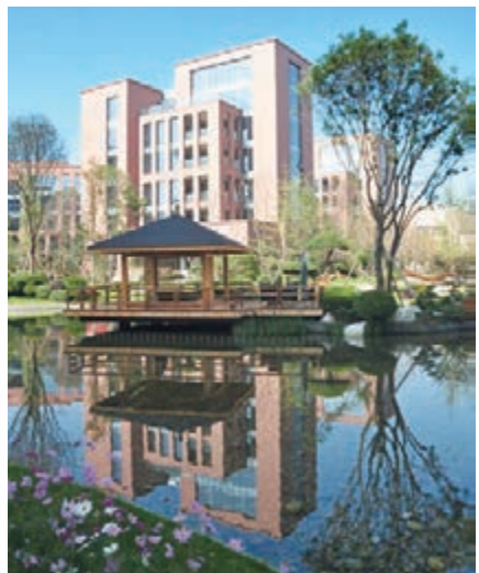
青羊工業總部基地實景圖