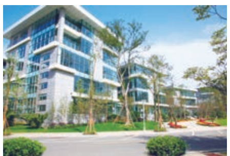
青羊工業總部基地實景圖

如何按照區委區政府和產業發展的要求建設好總部基地？成都青羊工業建設發展有限公司嚴格按照城市規劃、土地利用總體規劃和青羊工業總部基地的控制性詳規，通過「統一規劃、統一建設、統一投資、統一招商、統一經營、統一管理」的運作模式創新，保證了項目土地的集約化利用，實現了總部基地高標準規劃，高水平建設，高效益發展。規劃設計堅持「一棟建築、一個企業，一個園區、一種標誌」的理念，委託北京、日本的知名設計公司按照國際標準整體規劃設計；高水建設園區道路、管網、供電、供水、供氣、辦公智慧化基礎設施；高起點配套建設企業家會所、「時尚青年城」等綜合服務配套設施，為總部基地企業員工提供用餐、購物、娛樂等工作、生活全方位的服務；在創造一流的園區發展硬件載體的同時，還構築了融園林、建築、人文為一體的立體生態景觀，從而極大地提升了青羊工業總部基地和入駐企業形象。一家生產汽車檢測設備且佔領國內市場80%的企業，入駐園區前銷售一直徘徊不前。原因是代理商看到企業的辦公條