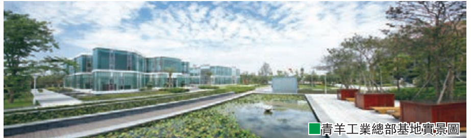
青羊工業總部基地實景圖

在招商引資中的引導作用，在企業總部基地的定位下，制定了投資強度、稅收貢獻、環境保護等招商條件，並由園區管委會辦公室副主任出任招商中心主任，對招商引資項目實行「一票否決」，嚴把項目引進關，推動「粗放型招商」向「集約型選商」轉變，取得了良好的效果。