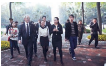
2010年諾貝爾經濟學獎得主克里斯托弗·皮薩里德斯參觀園區。

企業為什麼選擇入駐青羊總部基地？管委會辦公室副主任江穎告訴記者：「青羊總部基地佔地1089畝，分6期建設招商。2006年起，企業開始入駐。目前，1至4期已全部入駐，5期已全部完成招商，6期房產僅餘少量並出現了「一房難求」的情況。」入駐企業已達300多家，最終可達500餘家。入駐企業大都是成都以外企業，包括不少外省企業。其中，不乏國內百強企業。他們異地創業不容易，管委會既把他們當做業主，又把他們當做親人，每半年召開企業座談會，區委區政府領導、相關部門盡力幫助入駐企業解決交通、住房、家屬就業、子女讀書等問題。讓他們身在異地，確有家的感受，安心在總部基地創業發展。入駐企業將總部或區域總部、人事、財務、研發等放在園區，而