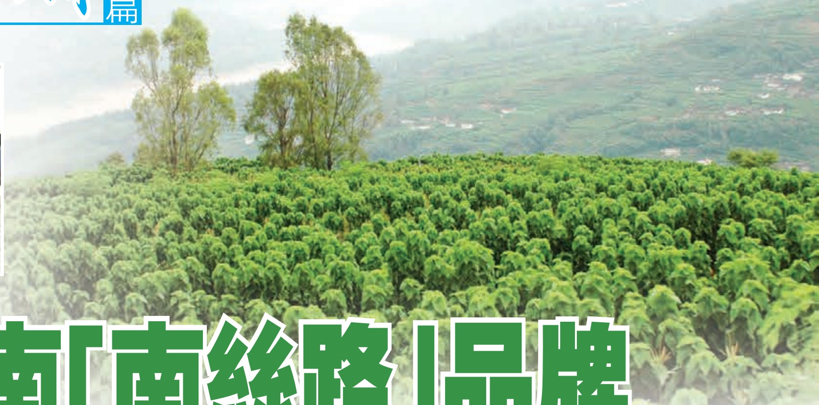
■金沙江畔桑園綠地