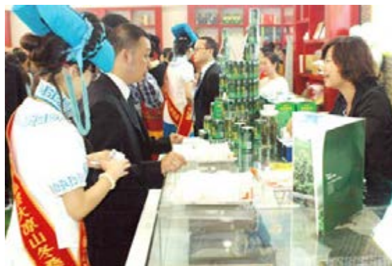
■第十四屆西博會上「南絲路」系列產品吸引客商。

「長期以來，俄羅斯人只喝中國茶，茶葉從幾千公里遠的中國陸路運過來。」俄羅斯一位著名作家在其文章寫道，在150年時間內，這種稀少又昂貴的飲料，風靡了全俄羅斯。今年9月，在有關部門的組織下，「金桑碧玉」冬桑茶和冬桑涼茶飄洋過海到俄羅斯。不少異國朋友，喜歡上了這款來自大