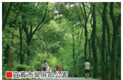
■宜賓市翠屏山公園

推進綠色工程。一是建成城市生活污水處理廠10個，城市生活垃圾處理廠10個，醫療廢物集中處理中心1個，設計處理能力分別達到14.1萬噸/日、1745噸/日、5噸/日，城市環保基礎設施得到進一步完善。二是建成五糧液、高州酒業2個省級生態工業園區，新建鹽坪壩紡織、白沙、江安縣陽春壩、翠屏區象鼻、宜賓縣高捷、