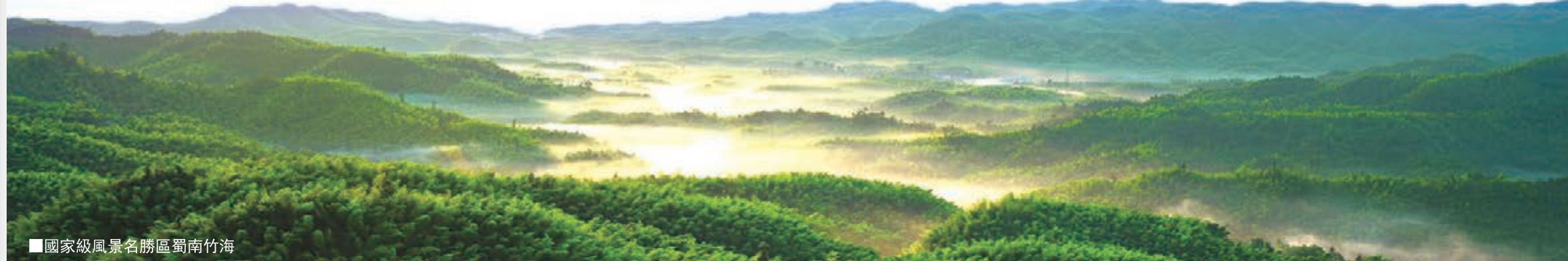
■國家級風景名勝區蜀南竹海