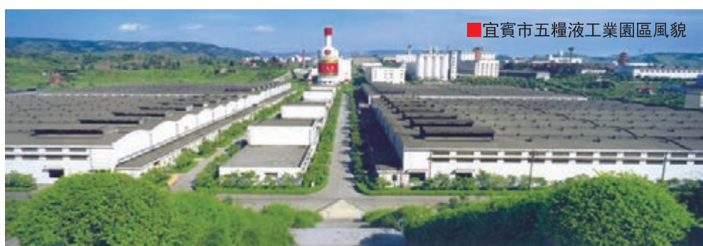
■宜賓市五糧液工業園區風貌

經過不懈努力，宜賓生態環境得到有效保護，綠色宜賓建設成效顯著。同時，2000年以來，宜賓經濟總量一直保持四川省前4位，位居雲貴川三省結合部城市第1位，實現了環境保護與經濟發展相得益彰。