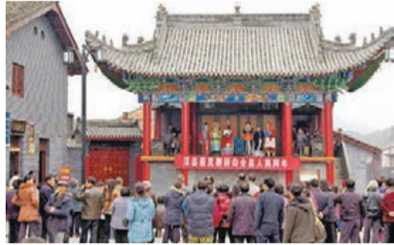
古鎮老街上入口處的清代戲樓。

人文薈萃 明清時期的老街群、戲樓風格獨特，客棧、當舖、酒肆、茶樓等舖板門一條街原貌保存，古城牆、古棧道等人文景觀歷史悠久……漫步在華陽古鎮的老街道裡，一股古樸風迎面撲來。