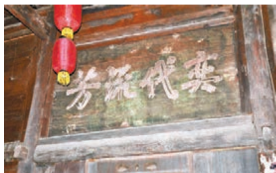
老街上住戶門楣上「奕代流芳」牌匾。