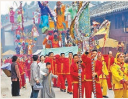
古鎮懸台社火表演。

幾百年傳承下來，懸台社火已成為華陽百姓喜聞樂見的一種民間藝術活動。如今，每到春節時，懸台社火會吸引眾多百姓前來觀看，平日寧靜的古鎮便格外熱鬧。