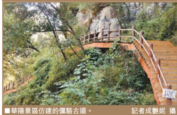
華陽景區仿建的儼駱古道。