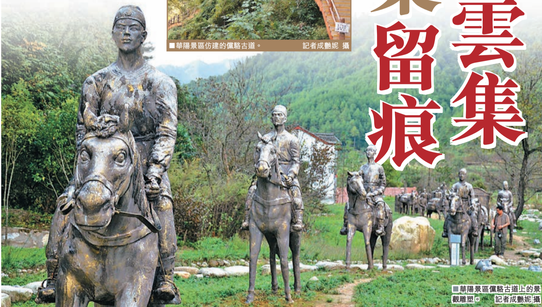
華陽景區儼駱古道上的景觀雕塑。

而華陽當地人最喜歡的要算是老街上入口處的那座清代戲樓了。此樓修建于清代初期，共兩層，高約8米，長約15米，寬約12米，樓頂施灰筒瓦，四角起翹，有風鈴。相傳古時這裡就是古鎮百姓休閒娛樂的好去處，經常上演秦腔、秧歌、皮影。如今，繁華雖已漸遠，但每逢節慶假日，人們仍會在此聚集，敲鑼打鼓，台上唱起秦腔名曲，盡情享受生活的美好。