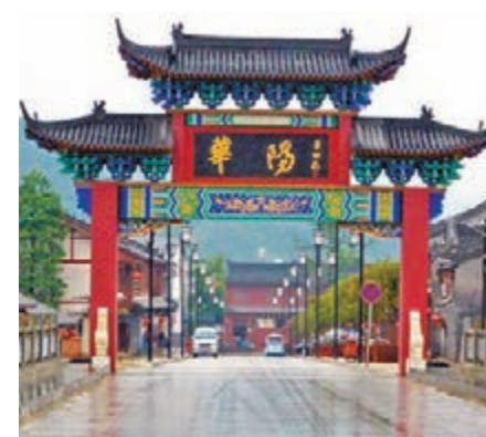
華陽古鎮街口。

南、貴州等地，均被稱為「華陽」。隨着歷史的演替，有「華陽」稱謂的地域越來越小，最終都湮沒在歷史的塵埃中，惟有華陽古鎮承載着歷史，名稱被完整地保留下來，古鎮歷史之深厚由此可見一斑。