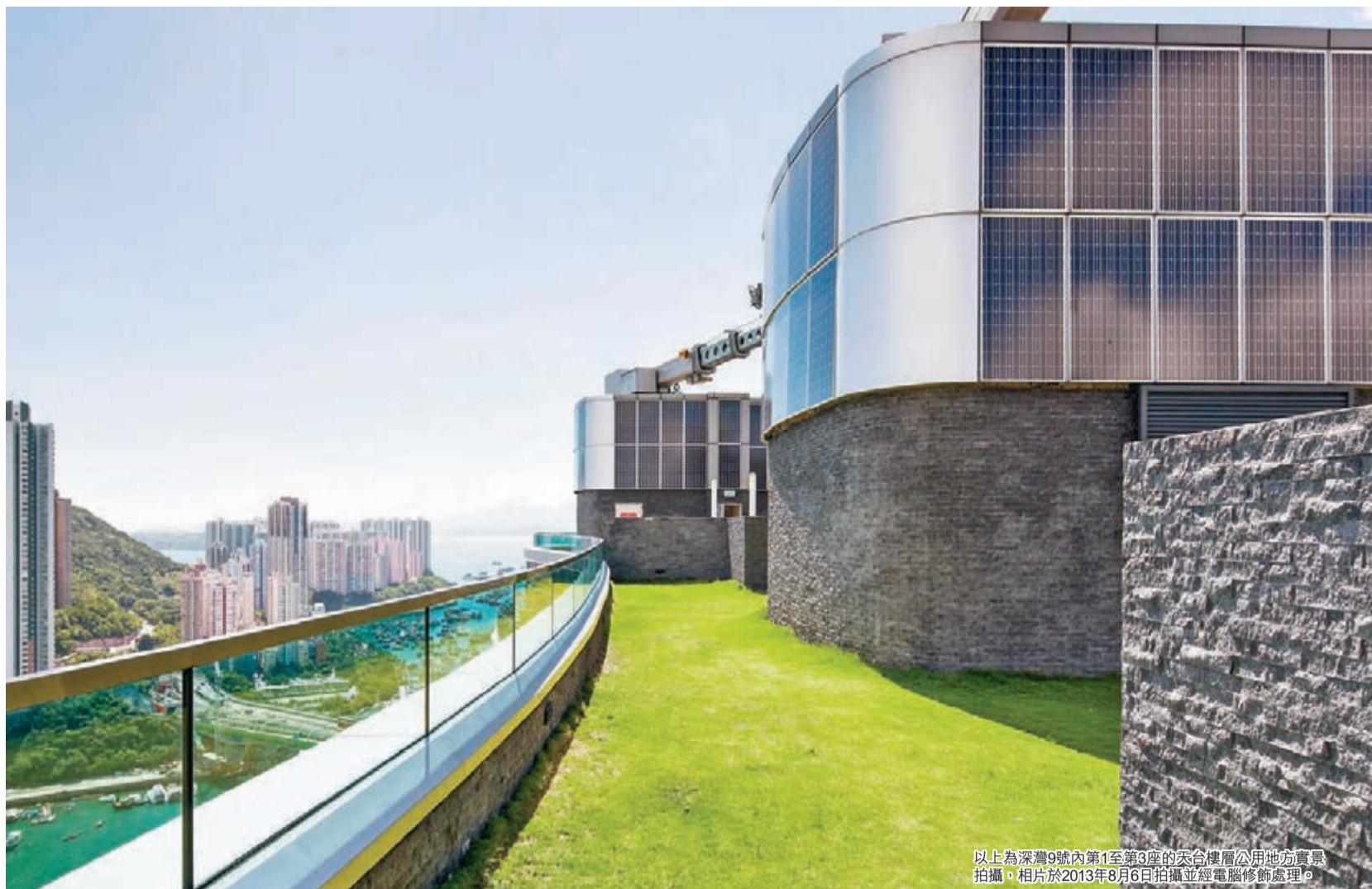
■設置於天台上的太陽能光伏板