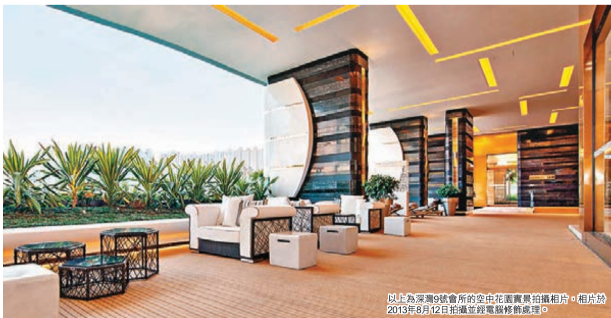
以上為深灣9號會所的中花園實景拍攝相片，相片於2013年8月12日拍攝並經電腦修飾處理。

「深灣9號」為臨海豪邸，戶戶向南，全部單位可享深灣遊艇會景，飽覽廣闊揚帆的景致。全新系列「深灣9號海洋珍藏版」Marinella Ocean Collection日前正式推出從未推出市場的19伙特色單位，包括花園洋房單位遊艇會系列The M Series*及頂層複式單位海天一色系列The S Series**。花園洋房單位遊艇會系列M Series*的「M」，寓意「Marina」，11個洋房單位的實用面積介乎2,565平方呎至3,622平方呎；頂層複式單位海天一色系列S Series**的「S」，則寓意「Sky」，8間頂層複式單位的實用面積介乎2,177平方呎至2,587平方呎。發展商邀請了國際著名設計師Rudolf Leong設計花園洋房單位10號特色裝修單位，靈感源自海洋的感覺，單位的室內設計及裝飾突顯出流線型曲線；至於第3座33及35樓B室的頂層複式特色裝修單位，則邀請了著名建築及室內設計師梁志天先生 (Steve Leung) 設計，整個複式單位以深淺啡色為基調，配合現代設計手法，配以鮮亮的色彩及線條俐落的飾品作點綴，再運用大量紋理豐富的高級石材。該項目結合了不少「尚綠」元素，貫徹了「深灣9號」一直提倡的「尚綠」生活理念與宗旨。