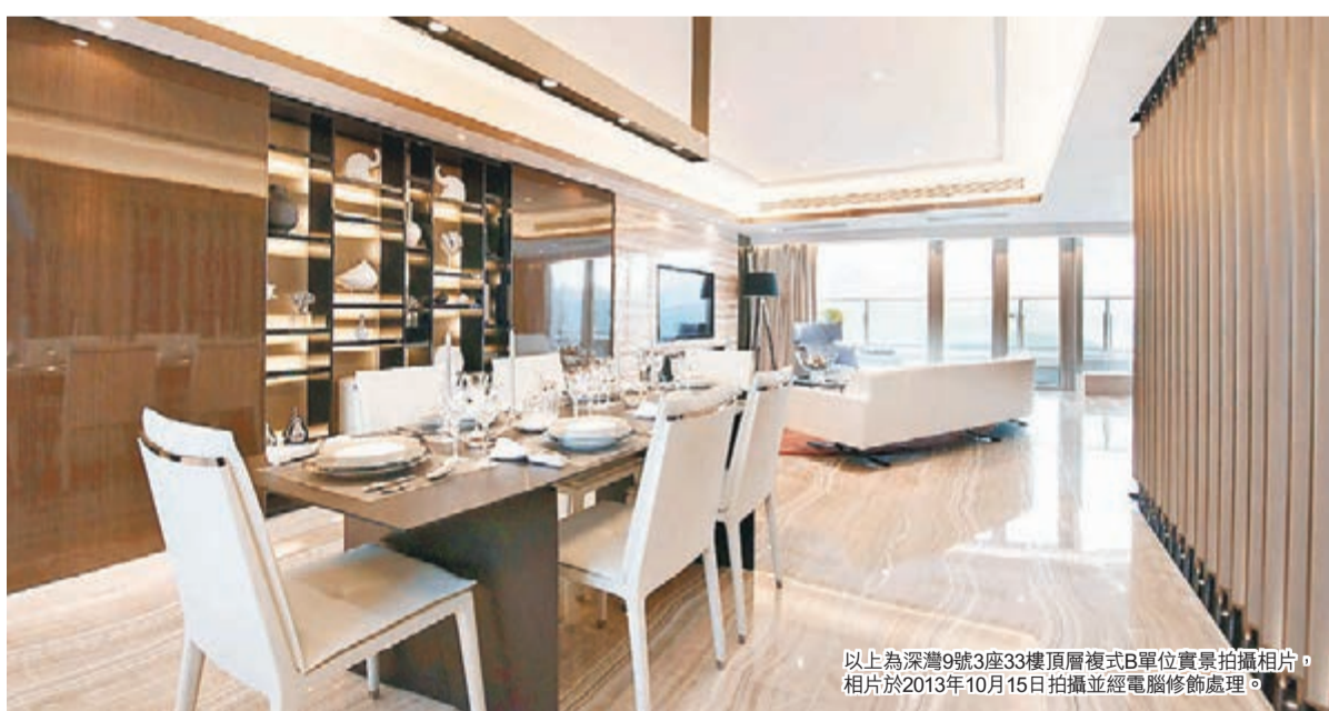
以上為深灣9號3座33樓頂層複式B單位實景拍攝相片，相片於2013年10月15日拍攝並經電腦修飾處理。