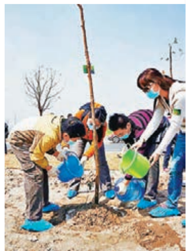
■東亞中國的員工參與植樹活動，一同綠化環境。

此外，東亞銀行亦會積極參與不同環保團體舉行之宣揚環保活動，藉此提高僱員及公眾對環保的關注。該行已連續5年參與由世界自然基金會舉辦的「地球一小時」節能行動，於指定分行及辦公室關掉非必要使用的燈光及室外光管招牌一小時。除了香港總部外，東亞中國、東亞新加坡分行，以及部分集團的附屬機構皆積極響應此節能行動，以示對氣候變化的關注。東亞銀行相信業界在未來亦會投放更多的資源，積極推動環保及提升社會各界對保護環境的關注。