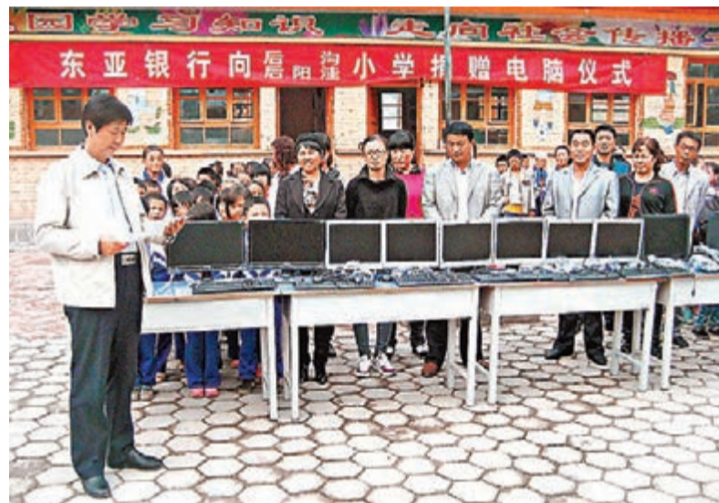
■將舊電腦重新組裝後，捐贈予內地貧困地區的鄉村學校。

果，該行不僅每年節省了90,000度耗電量，還成功獲得了香港電燈回贈部分項目投資以作鼓勵。