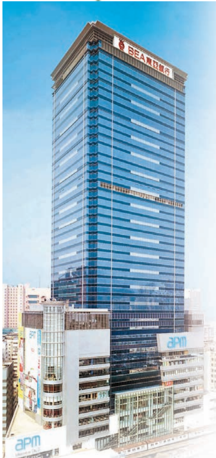
■位於觀塘的東亞銀行中心採用最新型的智能設計，使該行減少能源消耗，同時為員工提供舒適的工作環境。