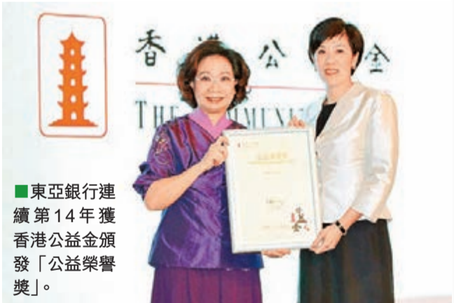
■東亞銀行連續第14年獲香港公益金頒發「公益榮譽獎」。

此外，東亞中國獲中國銀行業協會頒發「2012年度最佳社會責任實踐案例獎」，而東亞中國推出的「民間公益組織資助計劃」則獲頒發「2012年度公益慈善優秀項目獎」。