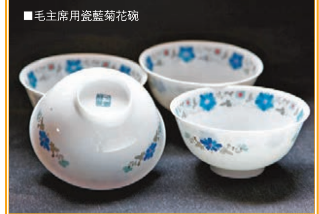
毛主席用瓷藍菊花碗

清代，至今已有上千年的歷史，形成了「白如玉、明如鏡、薄如紙、聲如磬」的工藝特點，蜚聲中外。1909年到1911年，醴陵釉下五彩瓷分別參展武漢勸業會、南洋勸業會和意大利都朗國際賽會，連續獲得金獎。此次參展的作品全部由國家級、省級大師創作，創意思路大膽新穎、技法工藝精湛巧妙、品種色調豐富多彩、個性表現千姿百態，代表了湘瓷的最高藝術水準。