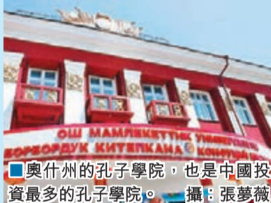
■奧什州的孔子學院，也是中國投資最多的孔子學院。

奧什的城市工業基礎是在蘇聯時期建立起來的，蘇聯解體之後，這座城市的工業開始走向衰敗，雖說現在城市的工業開始顯現出漸漸復甦的一點徵兆，但是開車行駛在蜿蜒的路上，沿途還是滿眼大片農田和矮小的屋舍，隨行的烏茲別克斯坦司機是六十年代的人，車程中他對我們說還是懷念蘇聯模式的時期，因為至少那個時候每個人都有事做，現在他很多兄弟已經無所事事，時日荒頹。因為此次旅行時值8月，正是這裡的枯水期，樹木乾枯，幾乎只有乾黃的樹枝，但是玉米長得十分豐碩。在路邊，人跡罕至，只有呼嘯而過的二手老式平治或者奧迪，而粗壯的吉族婦女將收穫的大玉米堆放在一塊藍色的粗布上，她們彷彿並不急迫經營，只要10元港幣，就可以將兩磅粟米抱到車廂，買回去之後放一點鹽煮熟，比美國的甜粟米更加甜，口感接近糯米，如果來奧什，真的值得一試。