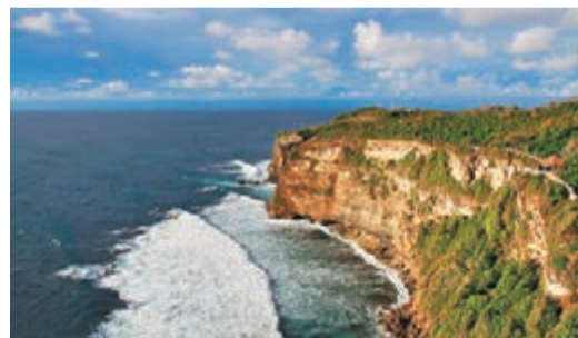
■印尼峇里島藍點灣情人崖是峇里必遊景點。 ■圖：中央社