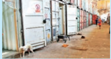
■吉爾吉斯斯坦與烏茲別克斯坦邊境處的市場——紅太陽，已經十分荒涼。