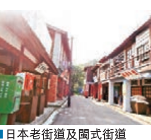
■日本老街道及閩式街道