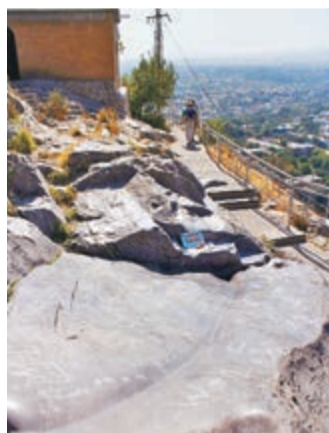
■當地人用來祈福的「滑石」

從列寧廣場步行5分鐘便可見當地的一座俄羅斯東正教堂，是在蘇聯解體後重新開放的，而吉爾吉斯斯坦最大的清真寺和建於16世紀的拉巴特·阿布杜勒汗清真寺都可以在奧什找到。說到此就不得不提這座城裡最大的宗教聖跡，也是吉爾吉斯斯坦唯一的世界遺產——蘇萊曼山，其實它提供了一個俯瞰奧什城市及郊區全貌的最佳觀測點，整個山體幾乎沒有植物覆蓋。有趣的是當地政府在一個山洞裡開設了個博物館，藏品涉及考古、地理和歷史文物的藏品以及關於當地動植物信息，如果有機會參觀即使是在炎炎夏季，也一定要穿上一件外套。山中另一處玄妙的神秘之景是位於山腰的「滑石」，不知它的中文應當怎樣翻譯，一塊光滑油亮的巨型岩片與山體相連，稍有坡度，伊斯蘭教徒會脫掉鞋襪，躺在石上，從高處滑下，往復三次，便是一種祈福。記者去的時候剛剛是周日的午後，當地人穿上單薄拖家帶口地來爬山，小孩子們會沉浸在滑石的快樂中，可能他們並沒有理解動作背後的宗教意味，只是孩童的玩樂，但是，你會感受到宗教滲透在日常生活的那種溫和。