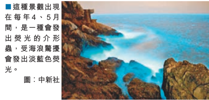
■這種景觀出現在每年4、5月間，是一種會發出熒光的介形蟲，受海浪驚擾會發出淡藍色熒光。 ■圖：中新社