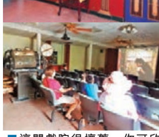
■這間戲院很懷舊，你可以欣賞舊片。