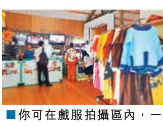
■你可以在戲服拍攝區內，一嘗古裝角色扮演，如皇上、皇后、宮女等。