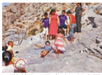
■蘇萊曼山是當地人民宗教活動的重要場所。