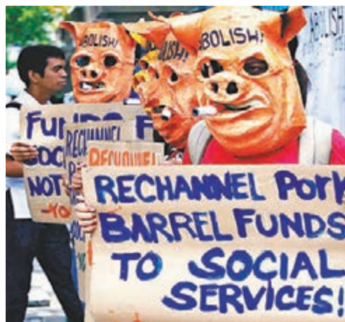
菲律賓民眾今年內舉行了多次反「豬肉桶」示威，以示對政府分肥制度的不滿。

絡國會議員，並影響他們在關鍵法案和政策上的投票意向。議員則號稱以PDAF資助地方私人發展項目，但實際上很多項目都不了了之，PDAF反對者早已批評官商勾結貪污公款，質疑撥款是否違憲。在兩周前的參議院聽證會上，有洩密者稱一半PDAF經費回流至議員口袋。目前已有3名參議員、數名前議員和一名女商人面對相關指控。