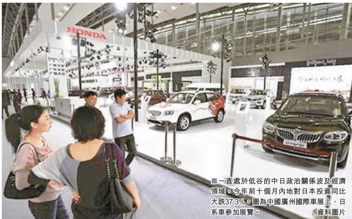
一直處於低谷的中日政治關係波及經濟領域，今年前十個月內地對日本投資同比大跌37.3%。圖為中國廣州國際車展上，日系車參加展覽。

近期，內地進出口處於持續波動狀態，引發了外界對能否實現預期增長目標的擔心。沈丹陽表示，未來外貿還將面臨持續的、多方面的困難，要完成全年外貿8%增速目標的難度比較大。但1-10月進出口已經實