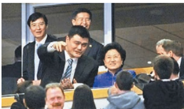
19日，在公牛與山貓的NBA比賽中，出現了姚明和國務院副總理劉延東的身影。姚明陪同劉延東一同觀看比賽。

香港文匯報訊 中國國務院副總理劉延東18日抵達芝加哥，展開為期8天的訪美之旅。由於十八屆三中全會剛剛閉幕，包括美國在內的西方國家對這次改革高度關注，劉延東將向美國介紹中國的改革計劃舉措。不過她在美國的重頭戲是21日的第四輪中美人文交流高層磋商。劉延東將和美國國務卿克里一道主持磋商，屆時雙方可能會提出促進兩國人文交流的新措施。