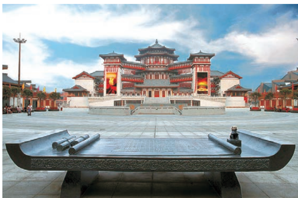
大唐西市支撐著整個絲綢之路的貿易體系，是絲綢之路真正意義上的起點

場，發展國際貿易的過程中，必然借助西安的國際通道和保稅物流倉儲等功能，實現其資源出口貿易的最大利益。