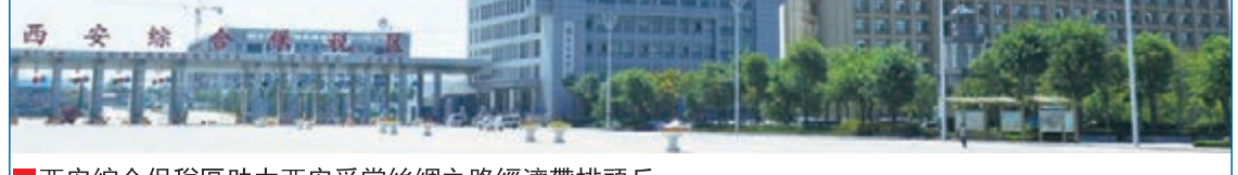
西安綜合保稅區助力西安爭當絲綢之路經濟帶排頭兵

據了解，隨着西安綜合保稅區的封關運營，下一步西安市準備對中國內陸港的功能進行再次升級和拓展——開通「長安號」（西安—中亞—歐洲）國際貨運班列。目前，「長安號」班列的前期調研已經基本完成，這項工作已經進入緊張的倒計時階段，預計今年年底正式開通運行。「長安號」國際貨運班列的開通，將進一步發揮陝西的交通優勢，暢通西安至中亞的國際貨運鐵路物流通道，為加強新亞歐大陸橋沿線各國與關天經濟區的區域合作構建新的橋樑，為把陝西建設成為國家向西開放的橋頭堡和國際物流集散地，積極融入「絲綢之路經濟帶」建設提供重要支撐。