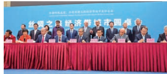
絲綢之路經濟帶沿線城市在西安發佈《西安宣言》

穿越千年的時空，「古絲綢之路」和「絲綢之路經濟帶」相互輝映，共同譜寫文明發展的新篇章。