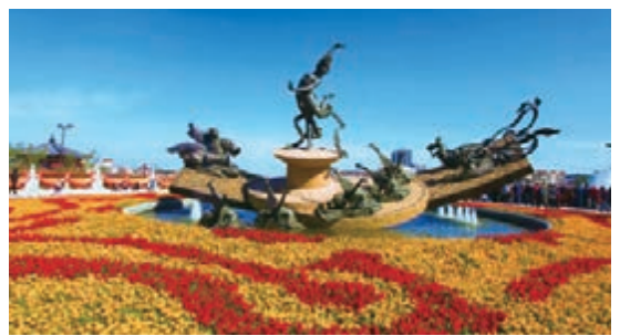
大唐華清城霓裳羽衣廣場