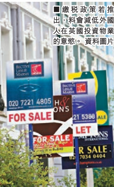
繳稅政策若推出，料會減低外國人在英國投資物業的意慾。 資料圖片

去年外國人購買倫敦房地產的金額最少達70億鎊(約873億港元)，十分驚人。目前英國約有500萬人在海外工作，暫無資料顯示有多少人在本地持有房地產。 ■中央社