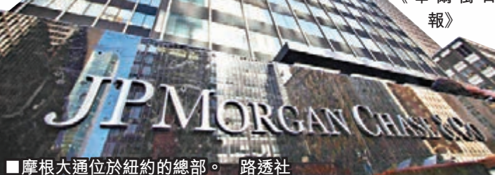
摩根大通位於紐約的總部。

摩通被指在2007年樓市泡沫爆破期間，向「兩房」房利美及房地美銷售按揭抵押債券，結果令投資者蒙受巨大損失，司法部正調查事件，暫未知會否向摩通作刑事檢控。 ■美聯社 /《華爾街日報》