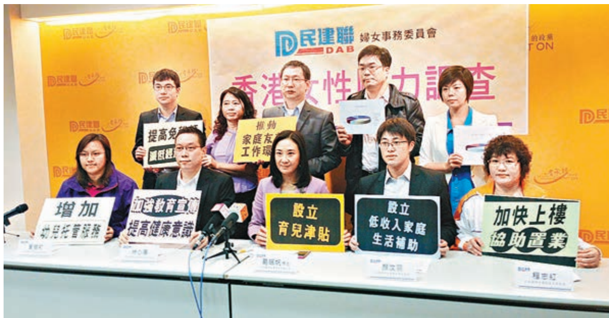
■民建聯調查發現，近三成受訪女性承受頗大壓力，並提出16項建議予政府跟進。