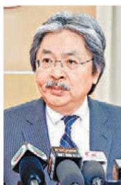
曾俊華稱，內地經濟表現仍然強勁，是亞洲區重要的穩定力量。

曾俊華指出，可幸的是，內地經濟表現仍然強勁，是亞洲區重要的穩定力量。剛剛閉幕的第十八屆三中全會強調，要進一步深化改革以推動經濟持續增長，為香港帶來龐大的機遇。他指，環球經濟變幻莫測，香港經濟面對的變數仍多，他會與他的同事作好兩手準備，一方面要把握一旦經濟好轉帶來的機遇，同時要保持憂患意識，隨時應付突如其來的外來衝擊。