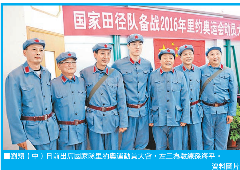
劉翔(中)日前出席國家隊里約奧運運動員大會，左三為教練孫海平。 資料圖片