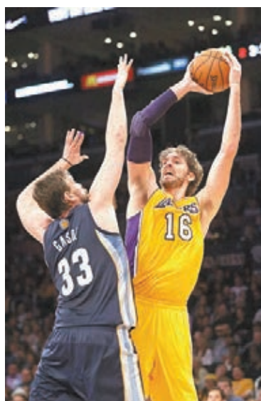
■加素(右)投籃時遭弟弟馬克封阻。