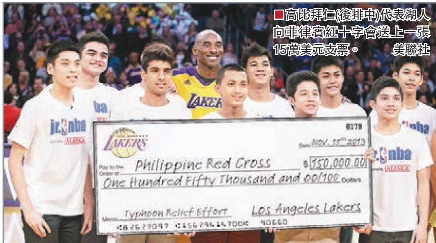
■高比拜仁(後排中)代表湖人向菲律賓紅十字會送上一張15萬美元支票。