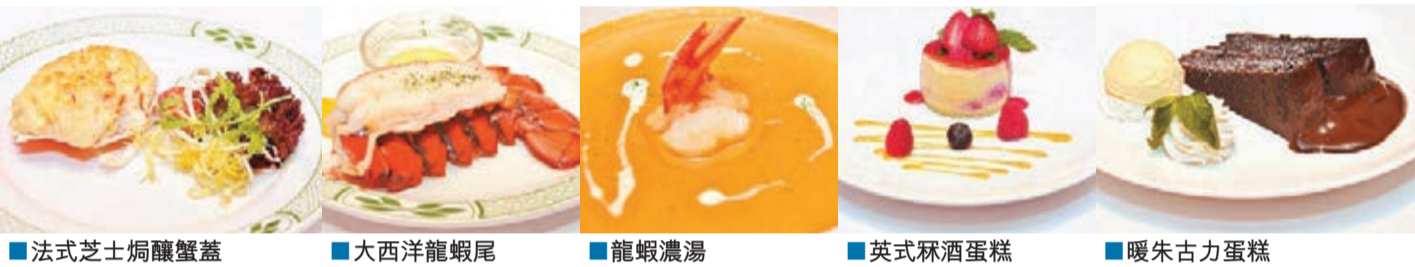
法式芝士焗蟹蓋 大西洋龍蝦尾 龍蝦濃湯 英式絲酒蛋糕 暖朱古力蛋糕