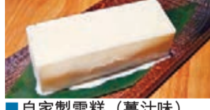
自家製雪糕(薑汁味)