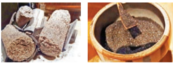
竹炭鹽是以豐富礦物質的日本深海鹽為原料，放進生長三年以上的青竹筒，經過三整天以攝氏1000度以上的高温燃燒提煉出來的食鹽。

照顧你的味覺，同時刺激你視覺。為讓大家可以嚐原汁原味的串燒，堅持不用醃料醃製食材，只用上簡單的調味料調味，當中包括專程由日本訂購的竹炭鹽，這種食鹽不但礦物質含量豐富，並具抗氧化及排毒功效，有助提升免疫力。而且還提供沙律，當中的紅菜頭大根沙律，師傅為保留紅菜頭和蘿蔔的水分特意把一層一層的薄片批出，再切成幼條，入口鮮甜多汁，甚花功夫和心機。