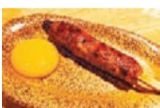
自家製紫菜蘇免治雞肉棒手打免治雞肉加上紫菜蘇及山芋製成，多重口感，沾上日本蛋汁，滋味無限。