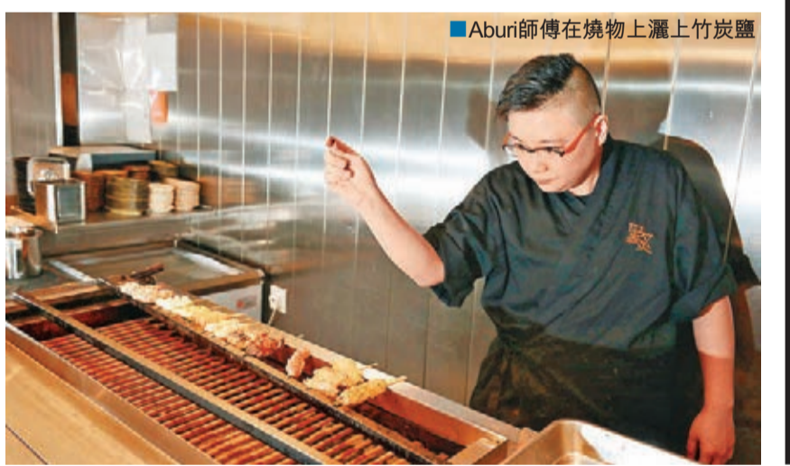
Aburi師傅在燒物上灑上竹炭鹽