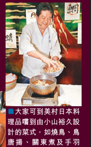
大家可到美村日本料理品嚐到由小山裕久設計的菜式，如燒鳥、鳥唐揚、關東煮及手羽燒。

位於日本四國東部德島縣，通過明石海峽大橋和大鳴門橋與本州相連，保留着許多自然景觀，其怡人氣候獨特地理環境，造就當地盛產不同美食，包括阿波尾雞、鰻魚、鯛魚、鳴門金時紅薯等。早前，德島品牌推進協議會邀得日本廚藝界封為「料理之神」，出生於德島縣，擁有宗師級崇高地位的小山裕久親臨香港獻藝，將最頂尖廚藝融入於德島縣的各種食材，弘揚日本細膩的料理精髓，由舌頭帶領大家品嚐德島美食。