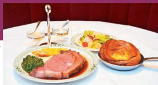
美國黑安格斯牛肉套餐

以前，吃東西通常只需要美味，環境如何通常都不太講究，但隨着時代轉變，進食佳餚前，總是要求環境要舒適，甚至食店融入設計的裝潢。最近，筆者走進兩間截然不同的食店，一間是美國餐廳，但感覺富中國傳統設計風味；一間是日本串燒店，卻感覺很有藝術時代感，據知此店還獲得室內設計獎，筆者身處其中，猶如置身在一間充滿藝術設計的Gallery中。當然，除了店內設計外，筆者更發現餐廳還加添了新元素，令你感受到意想不到的饗宴。