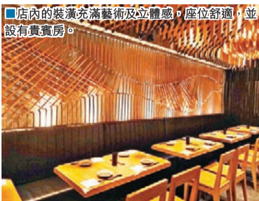
店內的裝潢充滿藝術及立體感，座位舒適，並設有貴賓房。