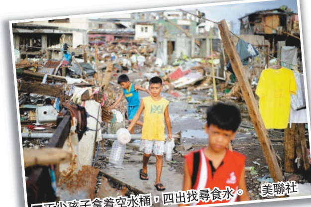
不少孩子拿着空水桶，四出找尋食水。

菲律賓風災過了超過一星期，但無數災民仍未能獲得救援物資。有救援人員向英國傳媒揭露，政府官員並無將物資公平地發放給所有災民，而是優先分發給一些在政治上支持他們的民眾，不論中央還是地方政府都沒兩樣。他指政府貪腐嚴重，故不敢公開身份，害怕因得罪