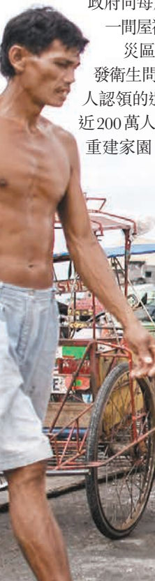
據菲律賓官方昨晚最新估計，海燕