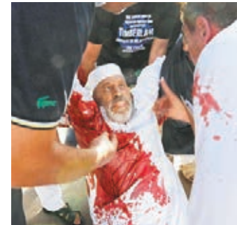
民眾將傷者抬離現場。路透社

利比亞首都的黎波里市郊前日有民兵組織向示威民眾開火，演變成激烈衝突，造成至少40死、逾400人傷。總理扎伊丹譴責民兵向手無寸鐵平民開火，並下令所有民兵組織離開首都，民兵指揮官則反指遊行人群先開槍。約500名的黎波里市民前日舉行和平示威，要求民兵組織解散，遊行至米蘇拉塔民兵的根據地時，民兵突以高射機槍、火箭炮及步槍向人群開火，死傷者包括一名12歲女童和一名老人。民眾逃走後帶武器返回現場，雙方激烈交火一整晚，至昨日仍有零星炮火。 ■路透社/美聯社/法新社