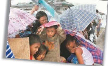
希望離開災區的災民，在機場冒雨等候機會。

中國外交部發言人洪磊昨日表示，中國政府願從人道主義出發，向菲律賓災區派遣緊急援助醫療隊。中國紅十字會下屬的「藍天救援隊」等民間救援機構表示願赴菲參與救災。中方就提供醫療援助一直與菲方保持溝通，一旦條件許可，中方救援力量將立即奔赴菲災區。 ■新華社