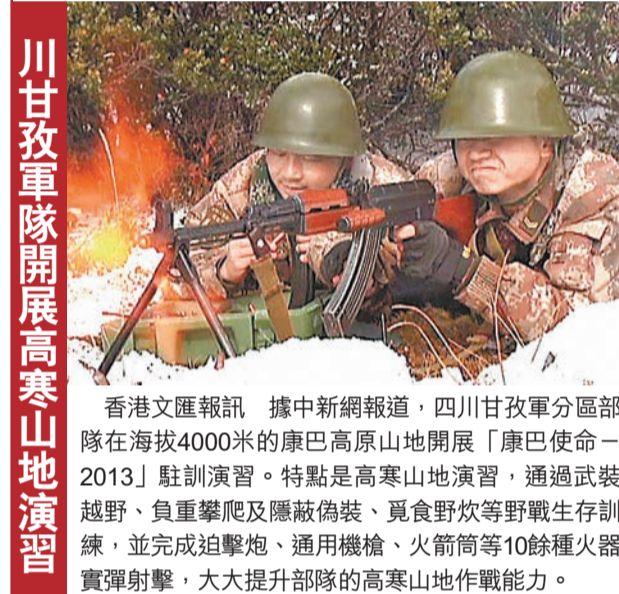
川甘孜軍區開展高寒山地演習

日媒:中國偵察機飛近釣島 另一方面,日本共同社報道,日本防衛省統合幕僚監部16日發佈消息,指當天下午,一架中國的「圖-154」電子偵察機飛抵釣魚島以北約150公里的空域,航空自衛隊的戰鬥機緊急升空應對。中國電子偵察機未進入日本領空。這是防衛省首次公佈發現「圖-154」飛行的消息。昨天新華社也證實,中國海警2337、2112、2151、2506公務船編隊,16日繼續在釣魚島領海內巡航。