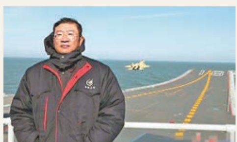
殲-15研製現場總指揮羅陽。