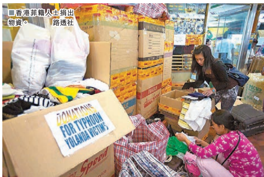
香港菲籍人士捐出物資。