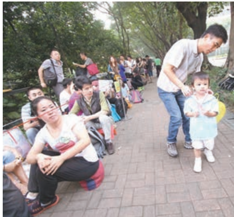
教育局務求盡早確認收生。圖為家長到幼稚園排隊取表情況。資料圖片