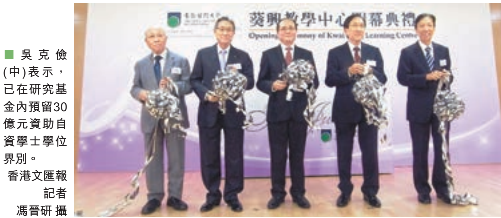
吳克儉(中)表示，已在研究基金內預留30億元資助自資學士學位界別。