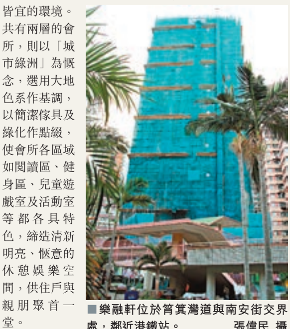
樂融軒位於筲箕灣道與南安街交界處，鄰近港鐵站。

「樂融軒」部分公共空間，如地下大堂及會所的設計均由本地著名室內設計師梁志天主理，手法時尚大方，以色調淡雅的優質建材，創造出和諧舒適、長幼皆宜的環境。