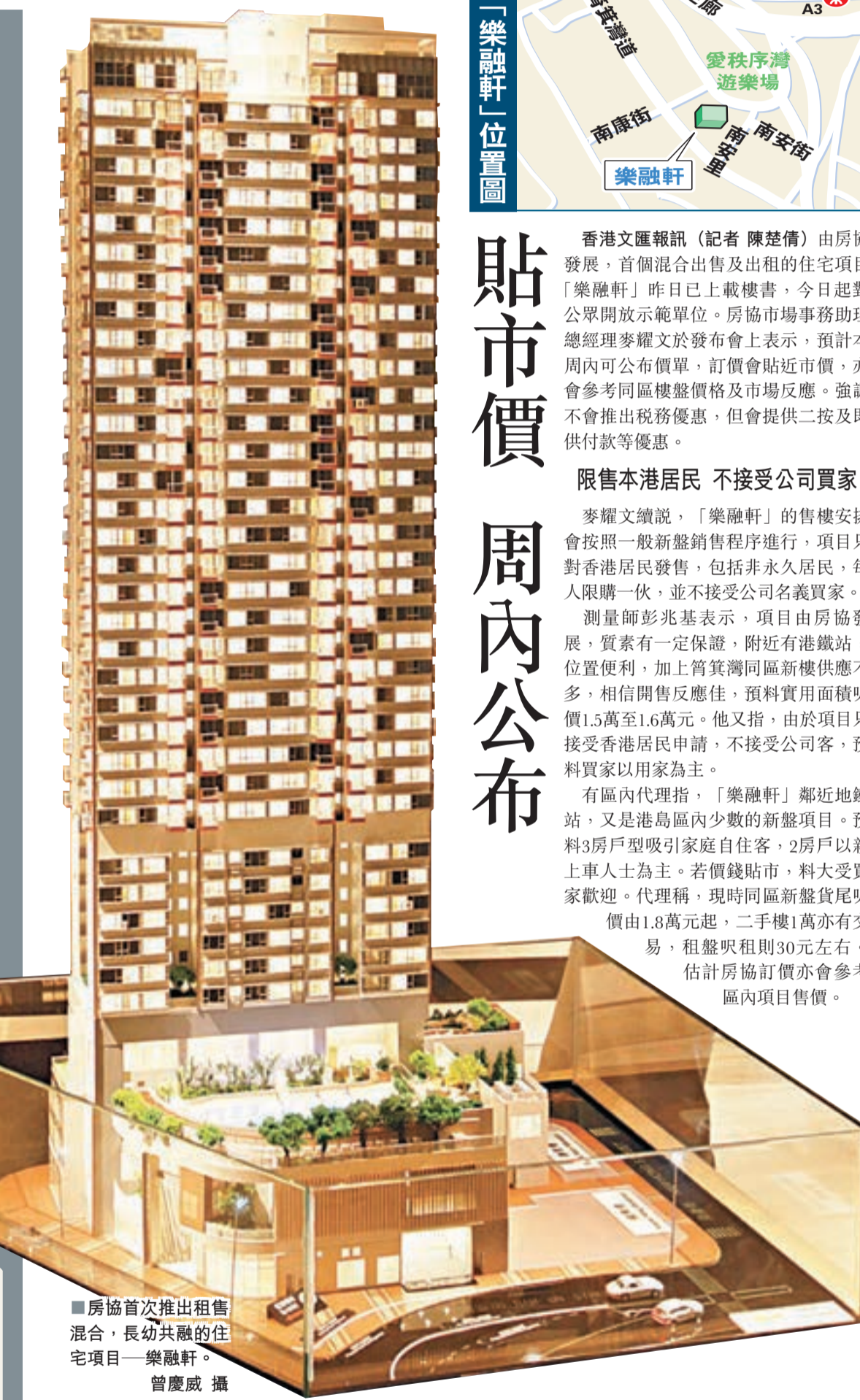
房協首次推出租售混合，長幼共融的住宅項目——樂融軒。