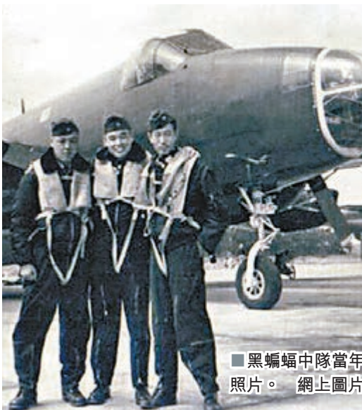
黑蝙蝠中隊當年照片。