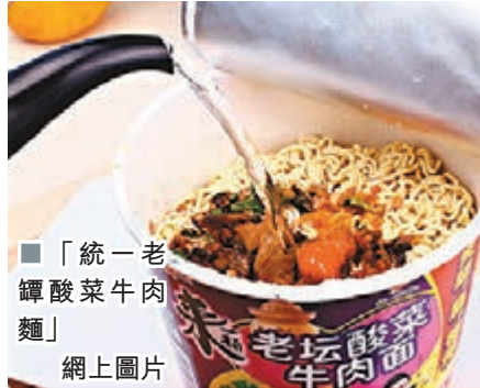
「統一老饕酸菜牛肉麵」網上圖片

香港文匯報訊 據中通社報道，正當台灣「黑心油」事件鬧得沸沸揚揚之際，有島內雜誌昨日公佈最新檢測結果，台灣市面售賣的各個名牌泡麵的油包居然都含銅、鉛、砷、汞等重金屬。被檢測的泡麵廠商口徑一致地強調，這些重金屬元素皆普遍存在於環境與食物中。專家則指出，儘管食品裡難免存在些有毒重金屬，然而只要超過一定濃度，都會干擾正常的生理功能，嚴重時還會導致基因突變而造成癌症。