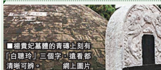
楊貴妃墓體的青磚上刻有「白聰玲」三個字，遠看都清晰可辨。網上圖片

陝西 興平馬嵬鎮楊貴妃墓，包砌墓體的青磚上被刻上「白聰玲」三個字。經仔細觀察，在楊貴妃墓還有不少遊客在青磚上刻上了深深淺淺的名字。唐楊貴妃墓，位於興平市西12公里處古稱「馬嵬坡」之地，其以「古塚留香，詩碑放彩」的獨特魅力而馳名海內外。它是唐代第七個皇帝玄宗李隆基的寵妃楊玉環之墓。 ■西部網