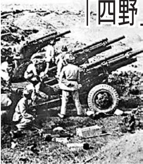
遼瀋戰役中的第四野戰軍。網上圖片

香港文匯報訊 據中通社報道，解放軍於國共內戰時期的「五大主力部隊之首」——第四野戰軍(簡稱「四野」)，與同時期台軍方在美國支持下成立的空軍偵察部隊——黑蝙蝠中隊，曾經互相敵對。近日70多名「四野」的「軍二代」組團往台灣旅遊參訪，與「爸爸的敵人」同桌把酒言歡，雙方坦言兩岸關係走到今天，在了解歷史的同時也要走出歷史。