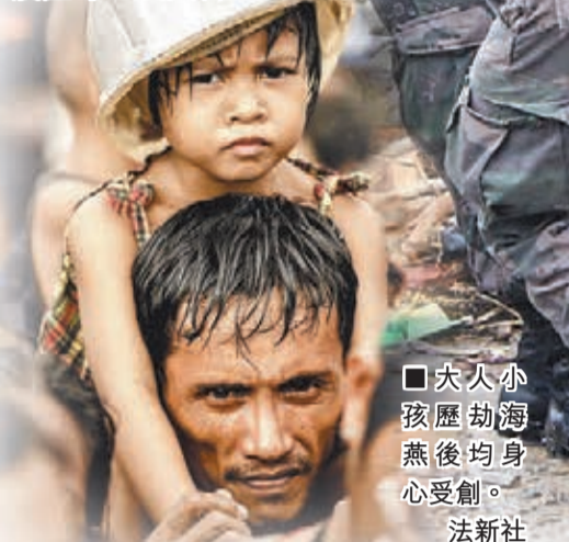
大人小孩歷劫海燕後均身心受創。

菲律賓遭受超強颶風「海燕」重創，聯合國估計多達1萬人遇難、66萬人無家可歸，警告要作好「最壞打算」。雖然部分救援物資陸續運抵災區，但難以及時交到災民手上。政府調動逾700名軍警和裝甲車前往重災區塔克洛班市維持秩序和實施宵禁後，治安改善，但有災民稱這只因已「搶無可搶」。當地缺水糧及藥物、滿地屍骸，惡劣情況恐觸發疫症等二次災害。