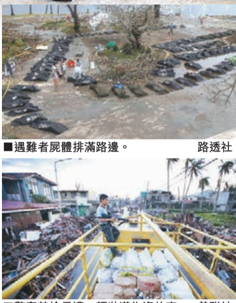
遇難者屍體排滿路邊。

甚至殺死警衛。菲內閣秘書長認為，災民生死關頭搶奪糧食衣物「情有可原」，司法部長德利馬亦稱「法律須兼備情理」。約15名武裝叛亂分子昨襲擊救援物資車隊，遭軍隊擊退並擊斃其中兩人。 菲國禍不單行，中部地區昨午發生黎克特制4.5級地震，宿霧亦有震感，未知對風災災區造成的影響。著名旅遊勝地科倫島因風災與世隔絕，據報島上白米存量只夠維持多兩日，市長請求政府盡快伸出援手。日本昨確認有27名在菲日人安全，仍有近100人下落不明。