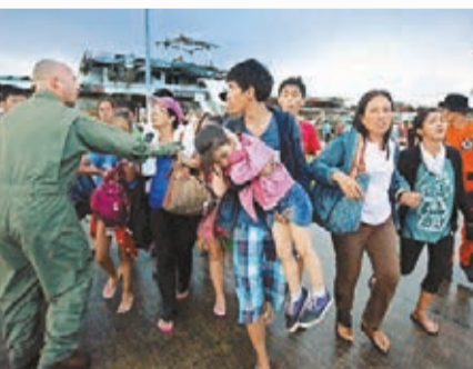
災民擔心沒位，在機場跑往登機。

另外，塔市位處的萊特島住有很多華人，大多經營雜貨店或貿易公司，島上更設有兩所中文學校。華商傅先生稱，其家族數代都在塔市居住，暫時只知90歲的姑媽跟她的孫兒安全逃到宿霧，其餘數十名親屬音訊全無。他提到其80歲叔叔的住宅在風暴期間起火，整幢房子燒毀，生死未卜。他在馬尼拉的親人計劃租用直升機往塔市，尋找失蹤親屬。