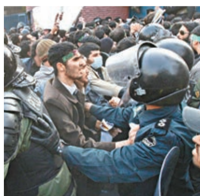
英國駐德黑蘭使館前年遭衝擊。資料圖片

稱，簽署路線圖表明伊朗願協助IAEA澄清針對伊朗核設施的疑問，回應某些阻礙伊朗核問題取得進展的「藉口」。