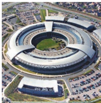
GCHQ入侵LinkedIn建立假頁面。資料圖片