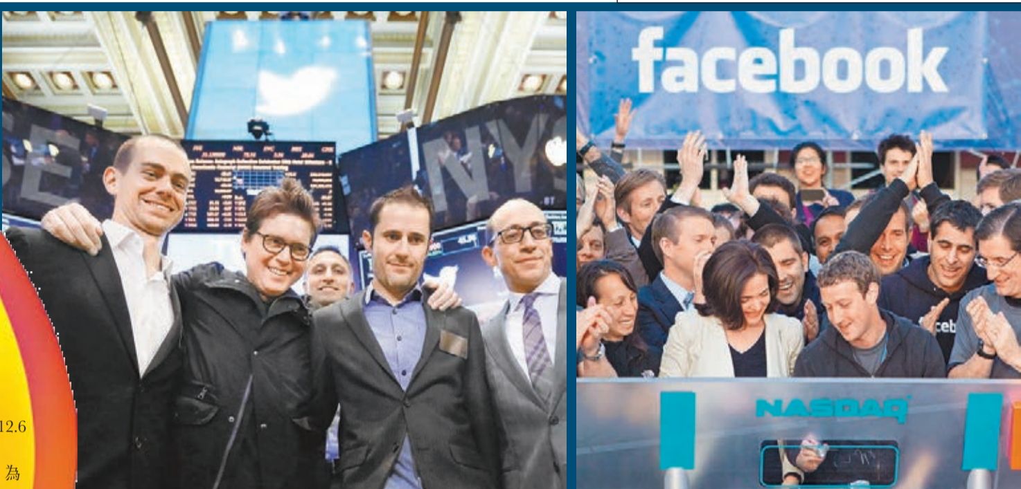
有投資者表示，微博twitter上周四上市當日(左圖)表現穩定，與去年facebook上市(右圖)形成強烈對比。