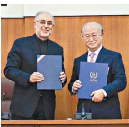
薩利希(左)與天野之彌簽署合作路線圖。

伊朗允許核查員檢查阿拉克重水反應堆和阿巴斯港附近的加鈾礦，但路線圖未提及受外界關注的帕爾欽軍事基地。天野之彌表示，3個月內將執行多項具體措施，並繼續與伊朗合作解決路線圖未提及的問題。薩利希