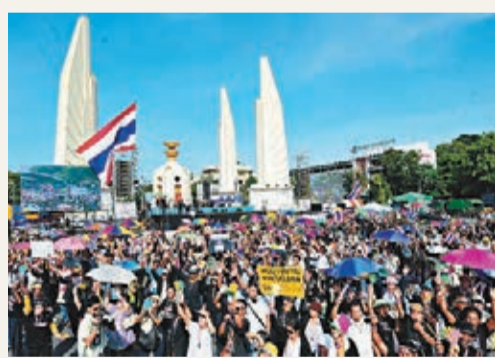
曼谷大批民眾示威。新華社

「自由」號今年7月準備與新加坡舉行聯合演習時發生電力故障，製冷系統和發動機均出現問題，之後更發現電腦網絡缺陷。軍方指這次是在檳宜海軍基地執行轉向檢查時發現技術故障，但問題較7月時輕微。【路透社】