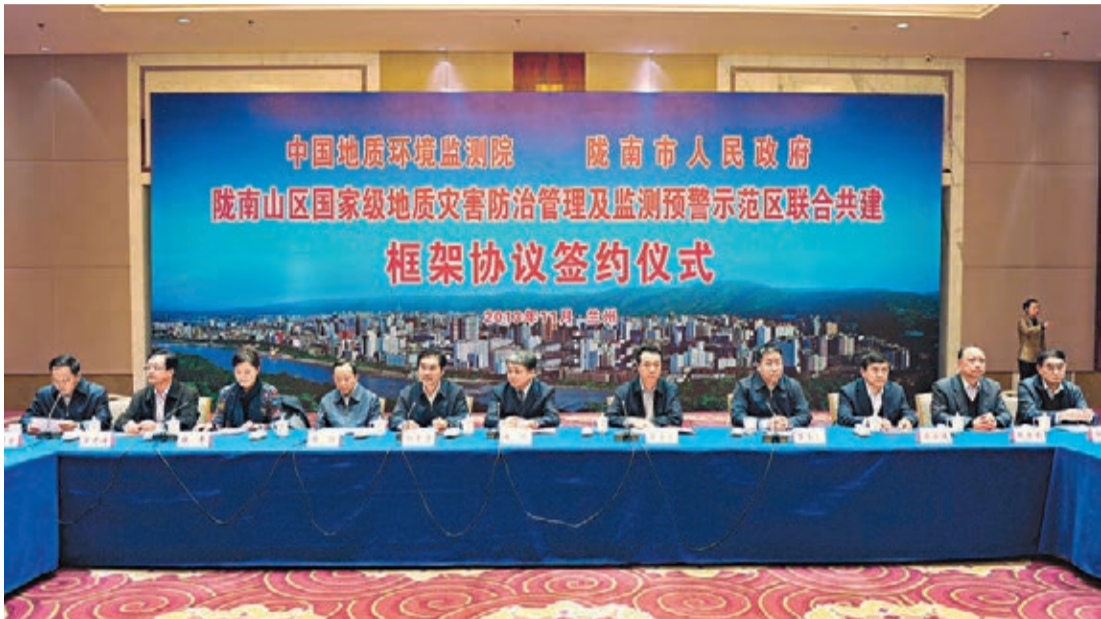
中國地質環境監測院與甘肅省隴南市政府簽署協議現場。

甘肅省隴南市位於岷山系和西秦嶺山地交匯地帶,地質環境脆弱,是全國滑坡、崩塌、泥石流四大高發區之一,全目前受地質災害威脅人口達61萬人。今年汛期以來,隴南市共發生17次大範圍持續強降雨,其中特大暴雨就達到8次。受岷縣漳縣地震以及強降雨影響,隴南市今年發生各類地質災害960處,直接經濟損失超過10億元。