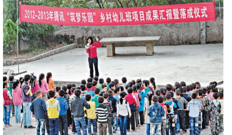
2012-2013年騰訊「築夢樂園」鄉村幼兒班項目成果匯報暨落成儀式。 貴州「築夢樂園」啟動 11日,騰訊「築夢樂園」鄉村幼兒班落成啟動儀式在貴州省黎平縣潘老寨小學舉行。2012-2013兩年間,騰訊公益慈善基金會出資300萬元,聯合政府資金等多方資源在雲南、貴州及廣東三省的109所學校捐建了165個幼兒班,其中近100個已投入使用。