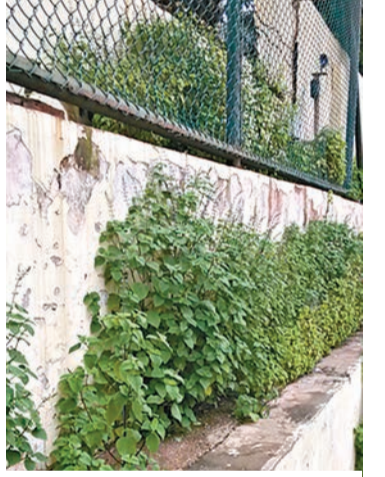
入侵物種椴葉鼠尾草在昆明呈蔓延之勢。 胡國雄博士建議環保、農業、林業等有關部門引起重視並阻止該物種繼續蔓延,在其開花之前人工拔除即是一種阻止其繼續擴散的有效方式。

香港文匯報訊(記者 馮鐵、通訊員 柏斌報)中國科學院昆明植物研究所博士生胡國雄、向春雷博士和劉恩德博士在對鼠尾草屬進行研究的過程中,確認外來鼠尾草——椴葉鼠尾草近年來在昆明附近有迅速蔓延趨勢。椴葉鼠尾草是原產中美洲的雜草,常在路邊、林下空曠地帶、廢棄的農田等地方成叢生長。「我們推測椴葉鼠尾草是90年代伴隨著花卉引種進入昆明,然後在昆明定居並成功歸化進而開始向周邊地區擴散。目前的調查結果顯示,椴葉鼠尾草主要分佈在昆明周邊的市縣,最遠擴散到四川省米易縣。」胡國雄博士說。據介紹,椴葉鼠尾草目前還未對當地的生態環境造成嚴重影響。但鑒於椴葉鼠尾草種子小而輕便,易向周圍擴散,因此胡國