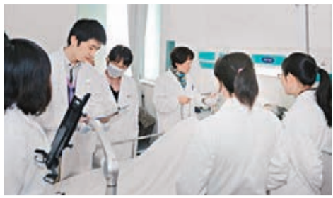
醫生為病人檢查身體。

香港文匯報訊(記者 袁巧 重慶報導)重慶市將啟動「醫療信息化技術綜合集成與應用示範」工程,建立區域醫療信息化綜合管理服務平台。日後病人在基層醫院看病,也可享受大醫院專家的診療服務。病人在基層醫院看病,醫生通過專用網絡把病人的電腦掃描、X光片等醫學影像資料實時傳送到異地的大型綜合醫院,讓大醫院的專家出具診斷報告並作出治療方案,可推動大醫院優質醫療資源無障礙流向基層醫院。