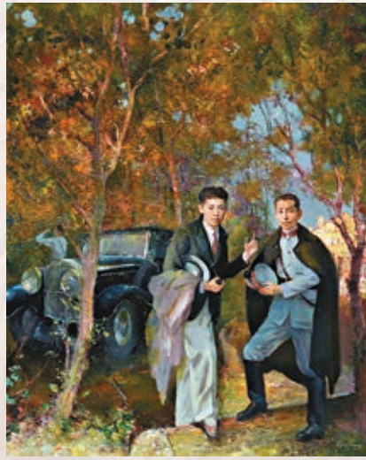
圖為《國運密談》。資料圖片

漢奸上門查詢。侯御之在通知杜重遠的同時，迅速穿上和服。由於她留學日本寄宿時，在望族家庭中聽到日軍界高層人物的名字，於是用流利的貴族日語說出來，日本人便沒有懷疑。她巧妙地擊退了這次突然襲擊。這是畫作《智退敵寇》所描繪的內容。作品《患難之交》描繪的是1937年杜重遠在太原八路軍辦事處與周恩來、彭德懷等商討抗日的場景。1943年，杜重遠在新疆殉難，《振臂天山》再現了這一時刻。