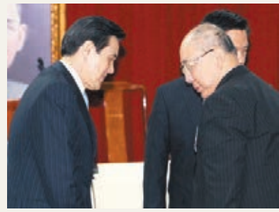
馬英九(左)與國民黨榮譽主席吳伯雄均出席中評會。

香港文匯報訊 據中社社報，身兼中國國民黨主席的台灣領導人馬英九，昨日參加國民黨十九屆中央評議委員會第一次會議時再談及兩岸關係，重申兩岸之間「不是外國關係」，是在「九二共識」基礎上發展的特殊關係。他進一步指出，無論在任何場合，台灣當局都不會推動「兩個中國」、「一中一台」或「台灣獨立」。