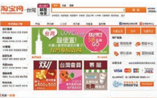
淘寶網趁昨日光棍節，在首頁推出「台灣專賣場」促銷。中央社

陳德銘在當天舉行的「2013福布斯·靜安南京路論壇」上作此表述。曾任商務部部長的陳德銘表示，電子商務是嶄新的模式，也是現代服務業的重要組成部分，由於大數據的支持，電商正在成為世界經濟中一個嶄新的亮點，並將深刻改變人們的消費、流通和生產。其中，跨境電子商務將快速增長。