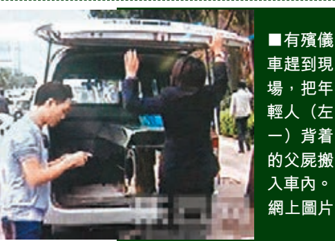
有殮儀車趕到現場，把年輕人(左一)背着的父屍搬入車內。

昆明西山區昆州路路邊有一名20歲的年輕人，為了讓逝去的父親「葉落歸根」，背着不幸病故的父親的屍體，從雲南瑞麗乘坐大巴走了600多公里的路趕到昆明，目的是回到老家。目擊者稱當時長途客車司機並沒察覺異常。年輕人的行為在昆明被人識破，屍體被搬入殮儀車，等當事人家屬處理後事，警方亦介入調查。