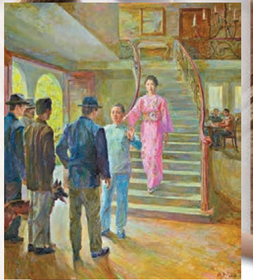
圖為《智退敵寇》。