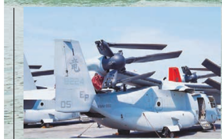
「好人理查德」號上的魚鷹飛機，飛機尾翼漢字顯示其為駐日美軍部隊