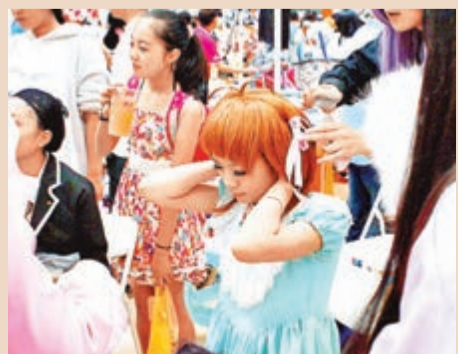
擻好妝的coser用心地戴假髮

這種模仿秀，作為一種遊戲，自我實現支撐於妝容、特效、服裝、道具、飾品。Cosplay妝面「輕柔、自然、典雅、誘惑」