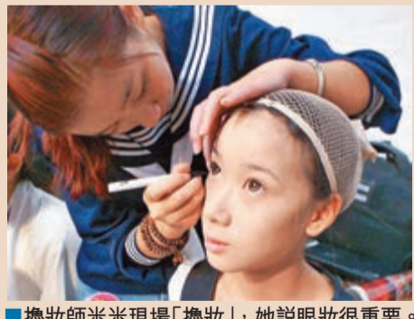
擻妝師米米現場「擻妝」，她說眼妝很重要。

昆明第四屆Cosplay盛裝大會，coser作為T台上的超模，在漫畫《盜墓筆記》中靈魂附體，走出時裝周春裝「泥土」的體味，野草的汗香，月亮勾勾的呼吸。現場，大多coser是來遊場的，自己花錢帶裝備來。