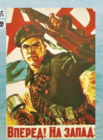
「明斯克」號航母中陳列的前蘇聯海軍徵兵海報

當看了俄、美、中、日四國不同的軍艦或海軍博物館後，感受到各國不同的軍事和社會文化時，人人都會去尋找自己心中的強國定義。