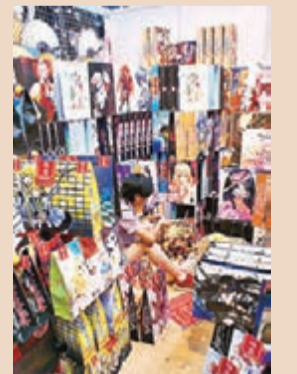
雲南動漫節現場的福袋店，裝滿了coser想要的角色。

是不變法則，為了讓妝容不花，不能吃午飯，喝水也只能用吸管，天氣悶熱，做一天coser捂一身大汗。