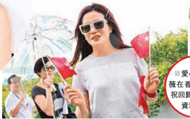
愛心大使趙薇在香港出席慶祝回歸活動。