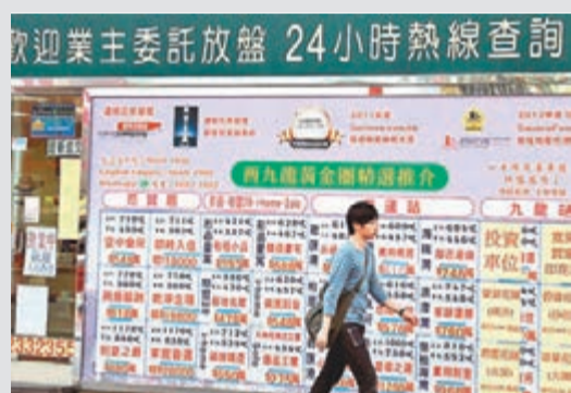
新來港者入住私樓維持在四成左右。

來港的內地新來港人士擁有高學歷的比率能夠快速提升，應歸功於政府近年推出多項輸入內地人才的計劃。(見表5)