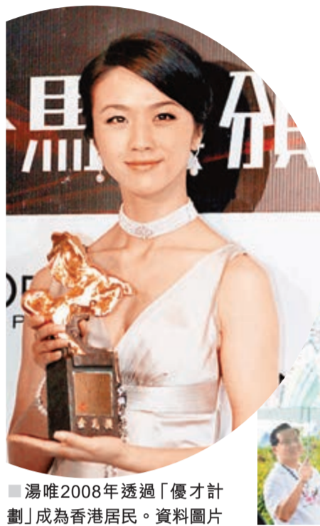
湯唯2008年透過「優才計劃」成為香港居民。資料圖片