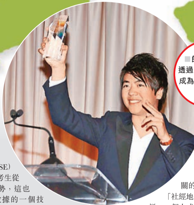
郎朗2006年透過「優才計劃」成為香港居民。資料圖片