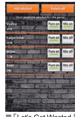
「Let's Get Wasted」

英國《星期日郵報》早前調查發現，酒精相關應用程式(app)泛濫令人憂慮。以遊戲「一起爛醉吧」(Let's Get Wasted)為例，用戶只須輸入「好友」名單及準備酒精飲品，程式就會隨機抽取一人「飲酒」。有英國政府官員批評，程式變相鼓勵青少年酗酒，呼籲Google及蘋果公司介入調查。調查發現，單在Google Play及蘋果App Store，就有逾340款類似app，數萬名下載用戶中，多數是18歲以下未成年人士。