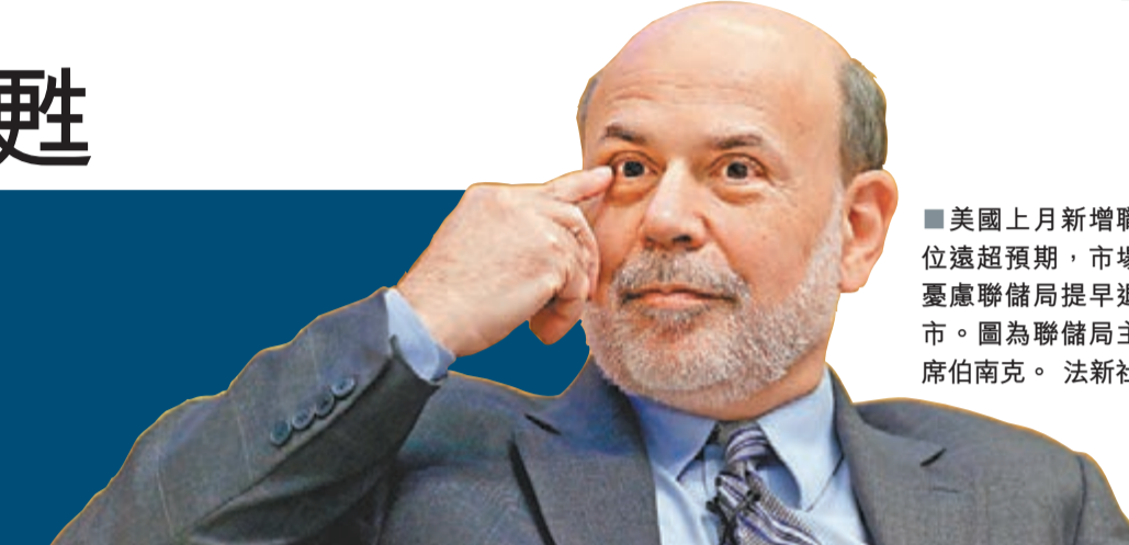
美國上月新增職位遠超預期，市場憂慮聯儲局提早退市。圖為聯儲局主席伯南克。