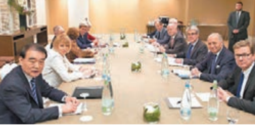
會談與會者全部重量級，包括美國國務卿克里和中國副外長李保東(左)等。

伊朗與安理會5個常任理事國和德國(P5+1)的核問題會談昨日結束，各方雖已收斂分歧，但未能達成共識，下周三將在瑞士日內瓦再次會面，期望本月內簽署協議。有外交官員透露，法國外長法比尤斯在談判尾聲才反對，影響合作。伊朗總統魯哈尼強調，維護濃縮鈾元素的權利是不可越過的紅線。