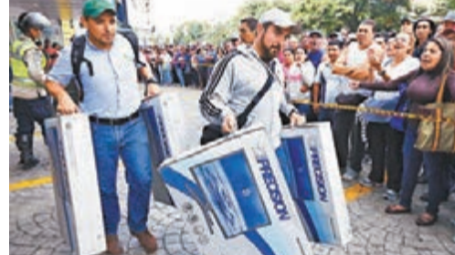
有民眾爭購兩部電視後開心離開。

委內瑞拉物價飛漲，總統馬杜羅前日派兵接管連鎖電子產品零售店Daka，迫令該店下調售價，又拘捕多名主管。輿論指，通脹率高企源於政府管理經濟不善、民生政策成效不彰，並非因商人斂財造成。Daka全線大減價後，首都加拉加斯一間分店吸引近500人排隊掃貨。有民眾認為，政府迫商人以合理價格售貨的做法正確。