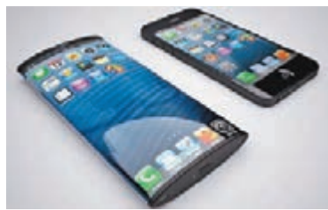
科技網站模擬曲屏iPhone。