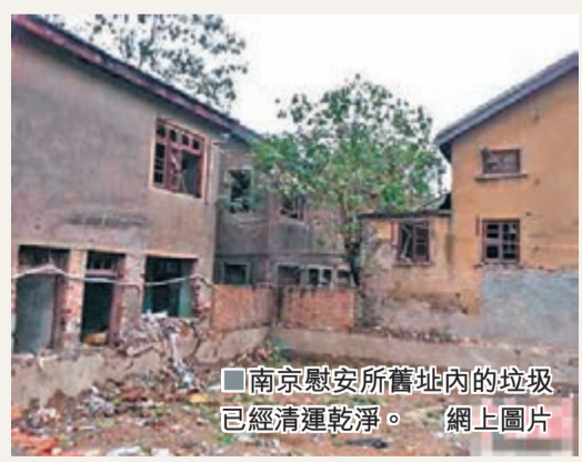
南京慰安所舊址內的垃圾已經清運乾淨。

香港文匯報訊 綜合消息：經媒體(包括本報11月7日A16版)報道了南京利濟巷的侵華日軍慰安所舊址損毀嚴重，西面的一個小院子成了街道的垃圾中轉站。當地街道負責人昨日表示，經媒體報道以後，他們立即作出整改，目前垃圾中轉站已經撤除，原先堆放的垃圾已經清運完畢。