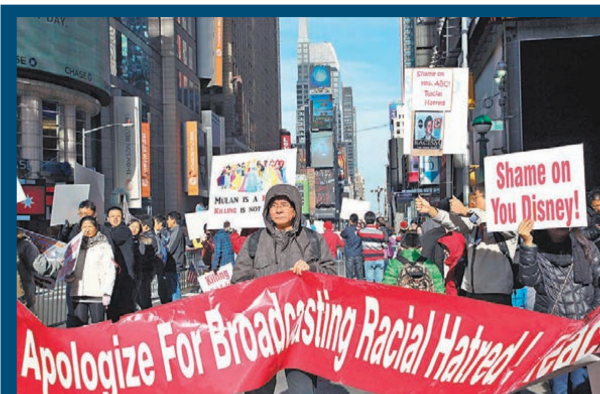
數百名美國華人華僑在紐約曼哈頓時代廣場舉行大規模抗議示威活動，強烈抗議美國廣播公司節目播出辱華言論。

在紐約地標性建築時代廣場，來自新澤西州、賓夕法尼亞州、紐約州的數百名華人華僑舉行大規模集會，舉