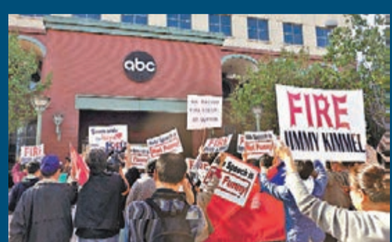
上千名來自南加州各界華僑華人代表在位於洛杉磯的美國廣播公司電視台總部外示威抗議。