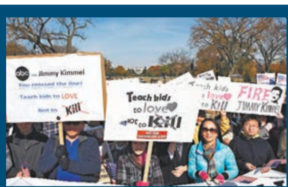
華盛頓華人華僑在位於白宮前的國家大草坪舉行抗議美國廣播公司辱華節目的示威活動。