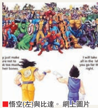
悟空(左)與比達。