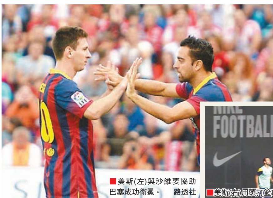
美斯(左)與沙維要協助巴塞成功衛冕。

美斯周中歐聯贏AC米蘭一戰打破場上連續366分鐘的小球荒賀個人第500場賽事，狀態回勇的他日前更用頭槌將球頂入籃，如要看片可登入網頁 www.youtube.com/watch?v=rp7wIPQ9EmA&feature=youtu_gdata 。