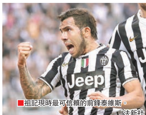
祖記現時最可信賴的前鋒泰維斯。