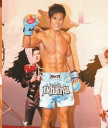
■有參賽者赤膊上陣示範打拳。