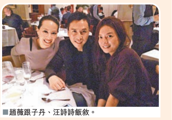
趙薇跟子丹、汪詩詩飯敘。

香港文匯報訊 早前甄子丹在太太汪詩詩陪同下，應邀出席在紐約舉行的第四屆中國電影節，吸引眾多美國觀眾到場支持。今年大會特別選出兩大子丹作品《特殊身份》及《葉問》，舉行電影作品展及分享會，安排當地傳媒與他真情對話，並向他頒發「亞洲最傑出藝人獎」，以表揚他對影壇作出之重大貢獻。由於子丹的功夫電影早於多年前已成功打進國際市場，故一連數天的紐約之行，子丹所到之處都受到人群簇擁，人氣可見一斑。