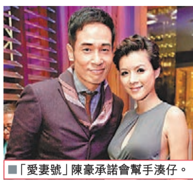
「愛妻號」陳豪承諾會幫手湊仔。